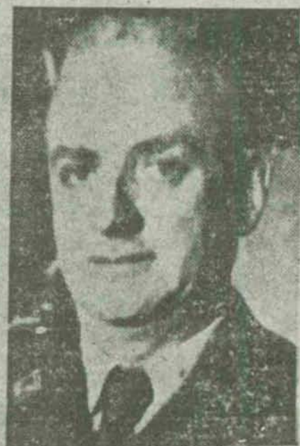
El ministro de Obras Públicas

La competencia profesional, preparación, patriotismo y dotes de organizador del general Fernández Ladreda son una garantía del mayor acierto en estos difíciles