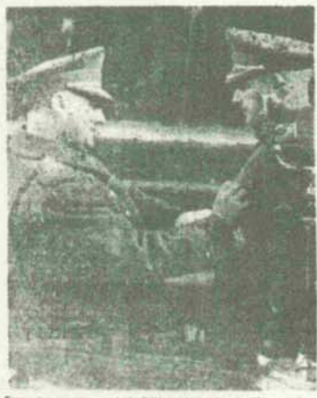
Foto: Impreso al momento del momento de la imposición de fajines a la nueva promoción de oficiales de Estado Mayor...