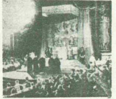
CIUDAD DEL VATICANO. El Santo Padre, el papa Pío XII, preside el Consistorio de Canonización de los santos Juan de la Cruz y Teresa de Ávila el día 27.