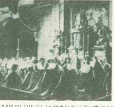
CIUDAD DEL VATICANO. Los nuevos Cardenales juran ante el altar de San Pedro el día 27.