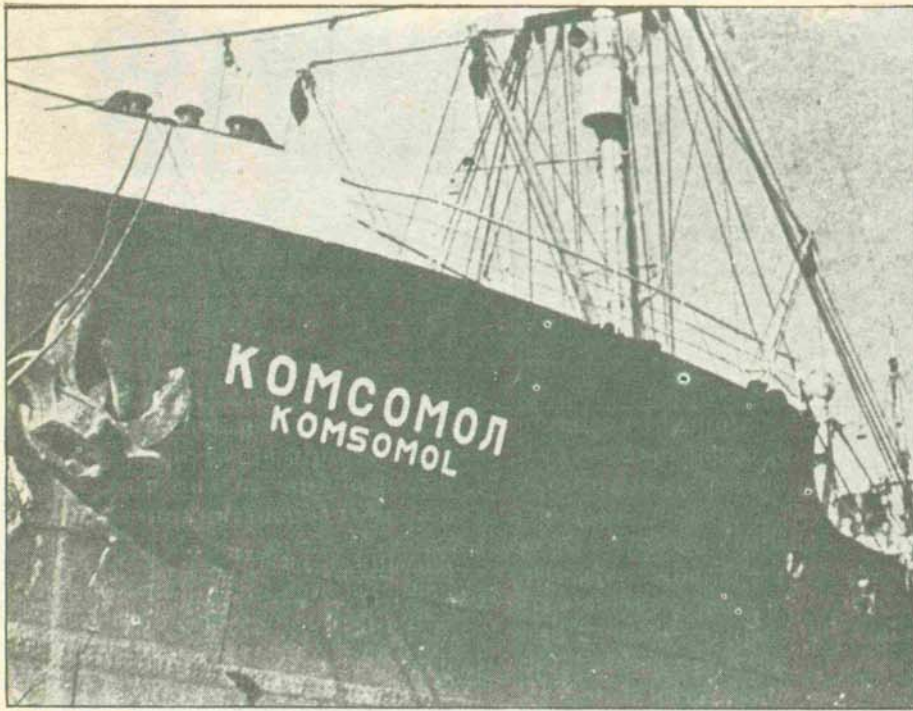
Después de descargar en el puerto de Valencia, el mercante soviético «Komsomol» —en la imagen— resultó hundido. En su libro sobre la guerra civil española, Hugh Thomas afirma —indebidamente al parecer— que fue un submarino italiano el agresor.

me parece estar empañada por una cierta animosidad y por ello, quisiera hacer las siguientes consideraciones: