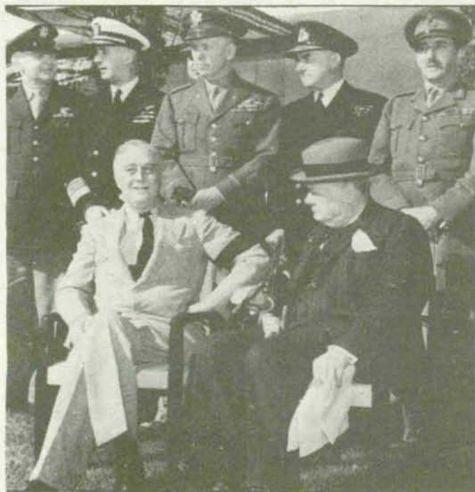
El Presidente Roosevelt y el Primer Ministro Inglés Winston Churchill, durante la Conferencia de Casablanca (enero de 1943). Detrás del Presidente norteamericano aparece en la fotografía el general George C. Marshall, y, tras Churchill, el mariscal Sir Allan Broock.

E L New Deal (Nuevo Trato) de Franklyn D. Roosevelt fue un loable intento de modernizar hasta donde fuera posible el anquilosamiento de una sociedad de consumo basada en la libre empresa, donde impera, como en la selva, la ley del más fuerte. La muerte del notable estadista en pleno ejercicio de sus funciones presidenciales frenó, como ocurriera con el asesinato de Lincoln, la aplicación de una política renovadora capaz de identificar a la puritana sociedad norteamericana con su tiempo. Este país no ha vuelto a tener otro Jefe de Estado con la talla de Roosevelt, a excepción quizá de Kennedy,