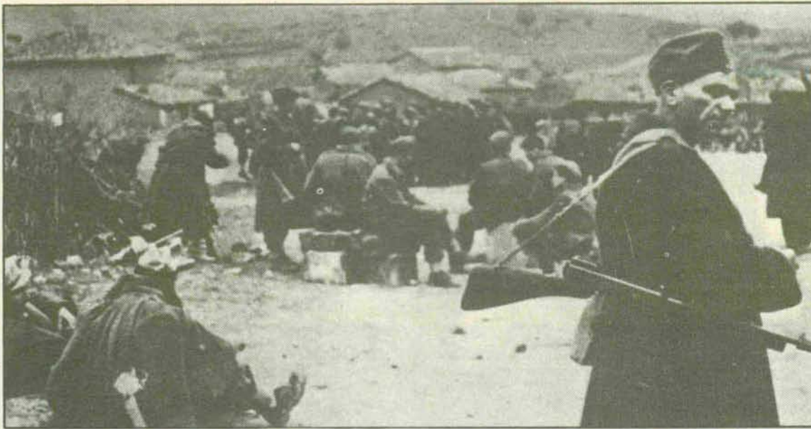
Partisanos del general Markos, durante la guerra civil griega de 1945-46.

los griegos anticomunistas. Ello significaba dejar la península y el archipiélago helénico a merced de la Unión Soviética, poniendo en peligro la balanza de poder en todo el Mediterráneo. Churchill había ya pronunciado en el Westminster College de Fulton, Missouri, su famoso discurso: «Desde Stettin, en el Báltico, a Trieste, en el Adriático, una cortina de hierro se cierra sobre el continente. Creo que la Unión Soviética no desea la guerra, sino cosechar los frutos de la guerra y extender indefinidamente su poder y sus doctrinas. En lo que he podido conocer a través de mi trato con nuestros amigos y aliados rusos, creo que no hay nada que ellos respeten menos que la debilidad, especialmente la debilidad militar». Palabras que siguen teniendo actualidad, vertidas por el célebre político conservador cuando había sido desplazado del poder por la mayoría de los electores ingleses poco antes de finalizar la guerra mundial.