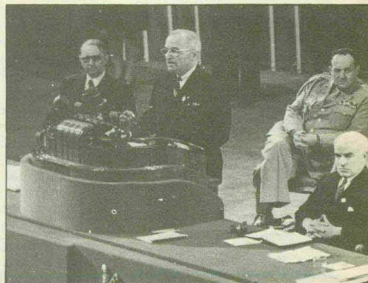
El Presidente estadounidense Harry Truman, durante el discurso inaugural de la Conferencia de San Francisco que dio origen a la Carta de las Naciones Unidas (24 de octubre de 1945).