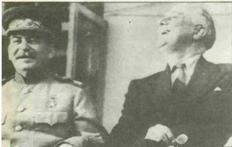
Stalin y Roosevelt durante la Conferencia de Teherán (1943).

Uno de los primeros problemas que se planteó a Truman tras la derrota nazi fue el de las guerrillas comunistas en Grecia, que amenazaban con derrocar al gobierno sostenido por Gran Bretaña: en febrero de 1947, el Gobierno laborista inglés notificó al de Estados Unidos que sus dificultades financieras y los conflictos derivados de su imperio colonial en descomposición le impedían seguir sosteniendo a