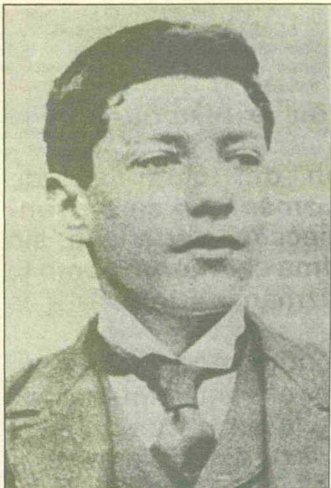
Martín Luis Guzmán, a los dieciocho años, cuando cursaba la preparatoria (1905).

riódicos y revistas o en los llamados y sonados medios de comunicación. Aunque Martín Luis Guzmán era miembro de la Academia Mexicana de la Lengua, en aquel entonces su matriz hispánica no se apresuró a celebrar el obligado acto de homenaje, dados los especiales méritos y circunstancias del autor de «La sombra del caudillo»; después, el tiempo agravó —o lubricó— la inasvertencia. Tampoco sus insignes colegas, a simple título individual, y las implicadas instituciones culturales y académicas remediaron un olvido que en craso rayaba.