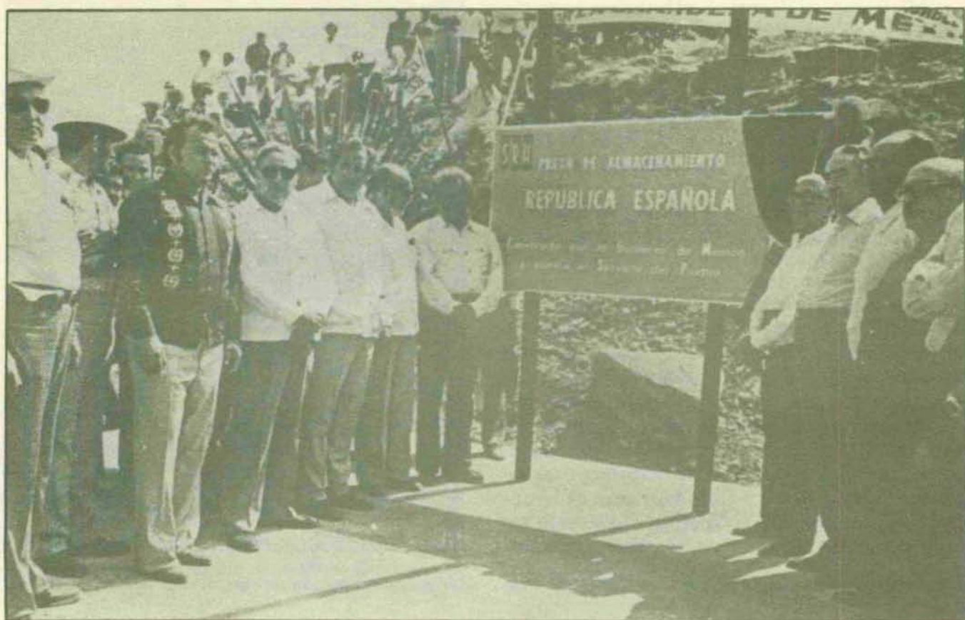
Inauguración de la «Presa República Española», que el Gobierno de México construyó en el Estado de Tamaulipas.

timiento independentista, parte con otros, más parejamente en relator, el movimiento revolucionario que de 1910 arranca, pero que se adhiere —tónica invariable en la conducta pública y periodística de Martín Luis Guzmán— a las Leyes de Reforma y al patriado cívico de Benito Juárez, que aspiró a destruir, y en buena cuantía lo alcanzó, la cancerígena fuerza económica de la Iglesia.