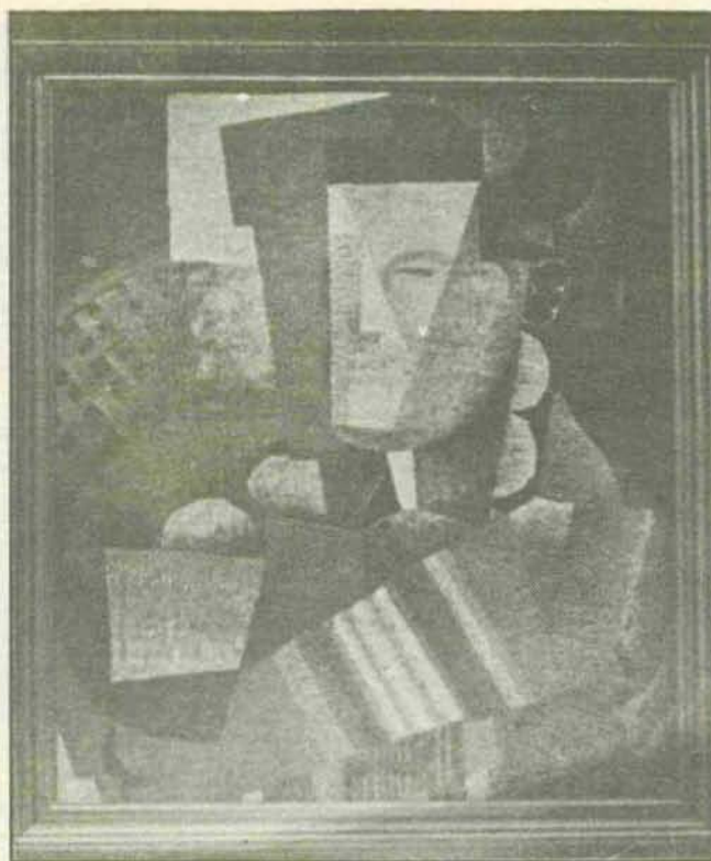
Retrato cubista de Martín Luis Guzmán, pintado por Diego Rivera en la segunda década del siglo, durante su etapa parisiense.

De familia criolla, nortea, entero el sen-