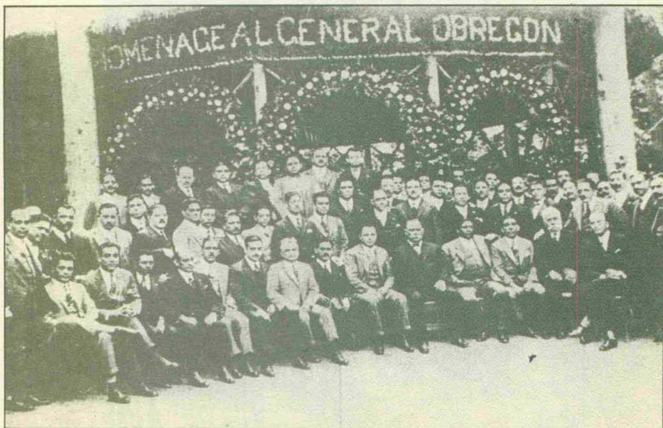
Homenaje al general Álvaro Obregón (junio de 1928). El Presidente electo, en el centro de la fotografía, el quinto de derecha a izquierda.