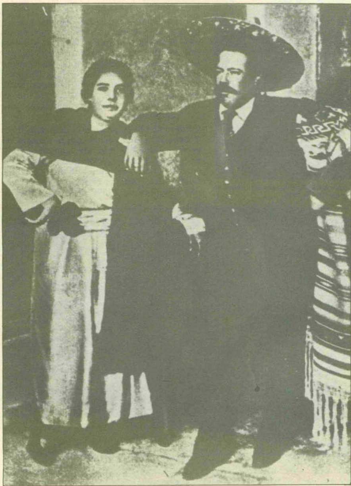
Pancho Villa y su esposa Luz Carral.

Por conductos particulares, y con hartos retrasos, llegó la noticia a España, también en la esfera «privada». Ni una parva gacetilla emanada de las agencias, ni un eco en pe-