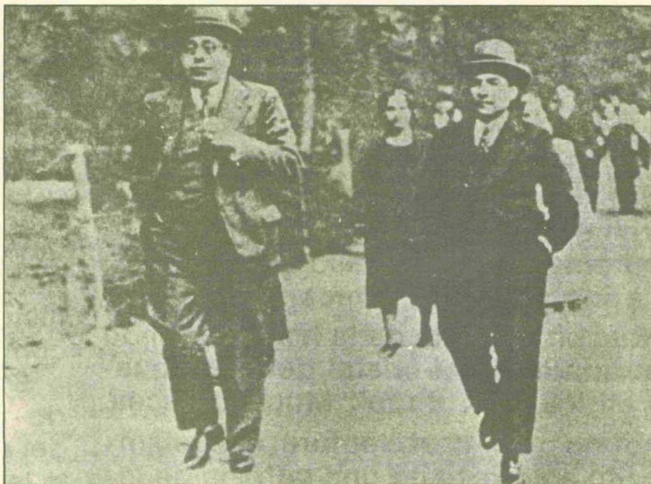
Martín Luis Guzmán con Manuel Azaña, Presidente de la República española, en Madrid (1932).