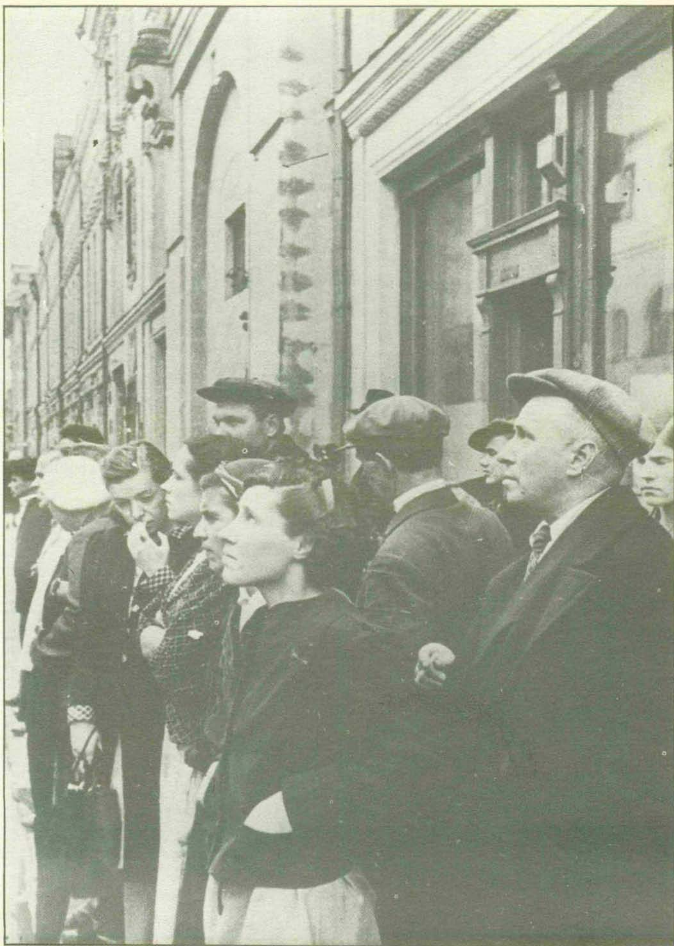
Con zozobra y esperanza escuchaban los soviéticos por la radio la voz de Yuri Levitan en los años de la guerra contra la Alemania hitleriana.