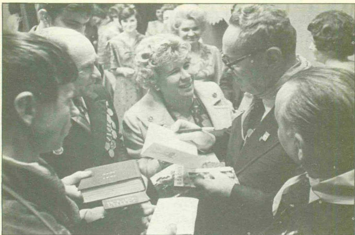
El locutor Yuri Levitan en tierras de Voronezh. Un autógrafo de recuerdo... (NOVOSTI).

tauradas, conservando su aspecto característico, las viejas calles.