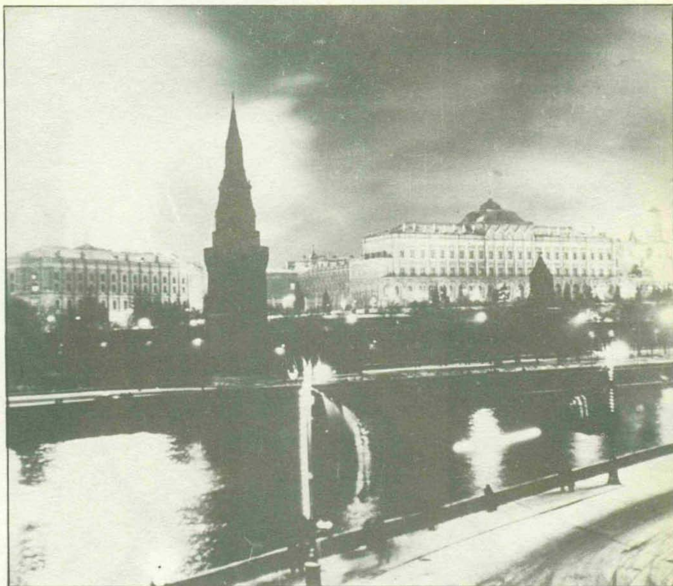
El Kremlin, perspectiva nocturna. (DALMAS).

madera, más tarde de piedra. Vivía allí la nobleza de linaje pobre y a finales de siglo a lo largo de la calle se elevaron edificios de varios pisos con negocios de comerciantes, tiendas, elegantes vidrieras y vivos anuncios. En Arbat vivieron Lev Tolstoi y Anton Chejov.