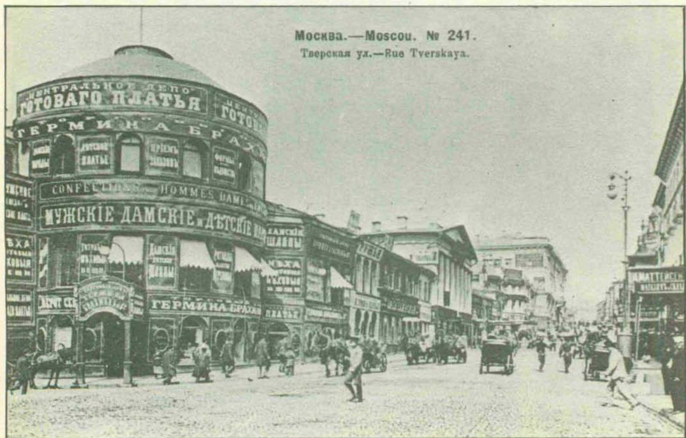
Москва.—Moscou. № 241. Тверская ул.—Rue Tverskaya.

rales, como instituciones para servicios a la población. Simultáneamente se es-