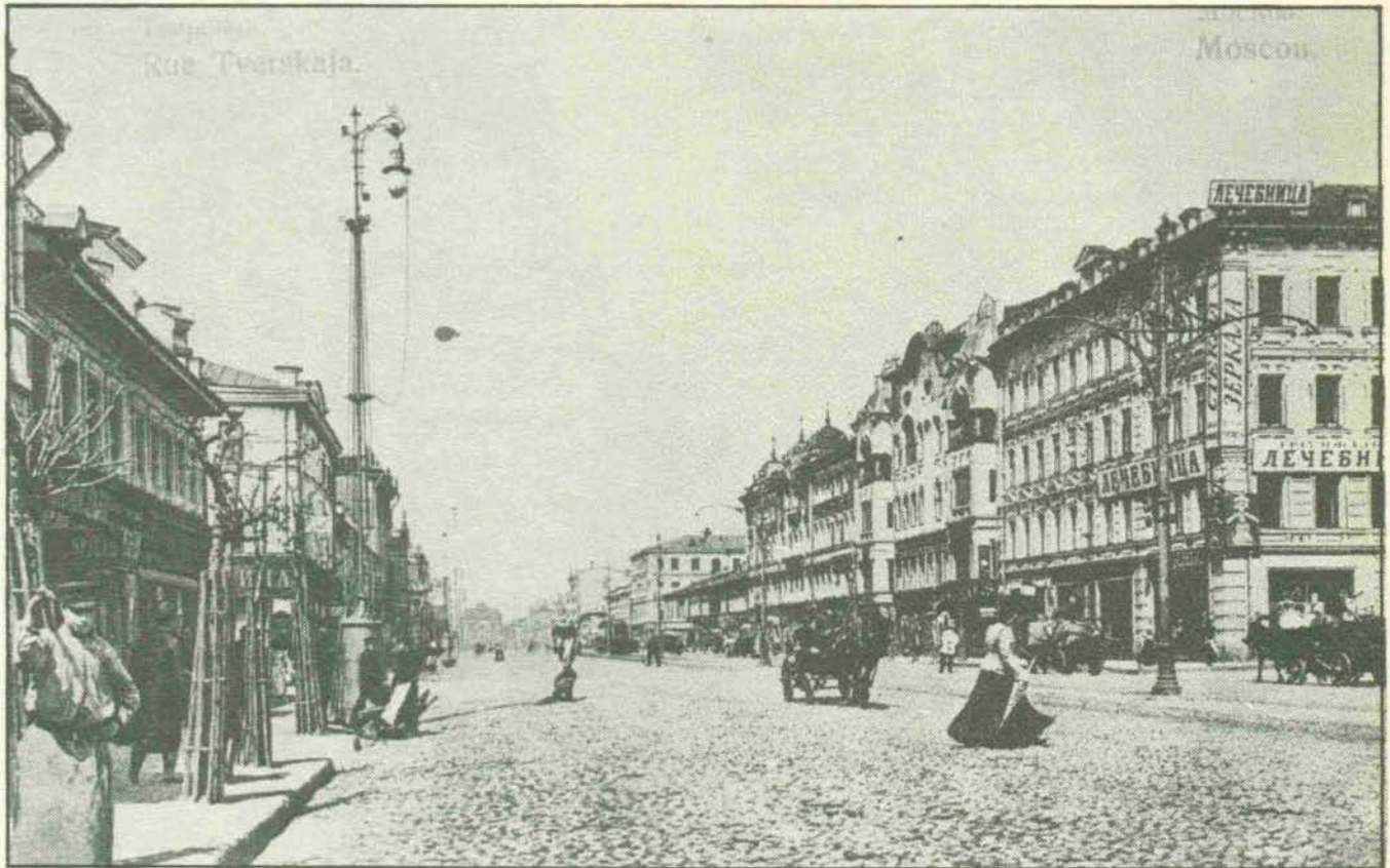
Otra perspectiva de la calle Tverskaya de Moscú, a principios de siglo.

jo. Aquí estaban situados monasterios, iglesias, posadas, embajadas, vivía la aristocracia. Por todos lados se podía encontrar comercios de venta, tiendas, almacenes, talleres de artesanos. Al reconstruir esta región la tarea principal consiste en determinar el nuevo uso de los antiguos edificios. Uno de los