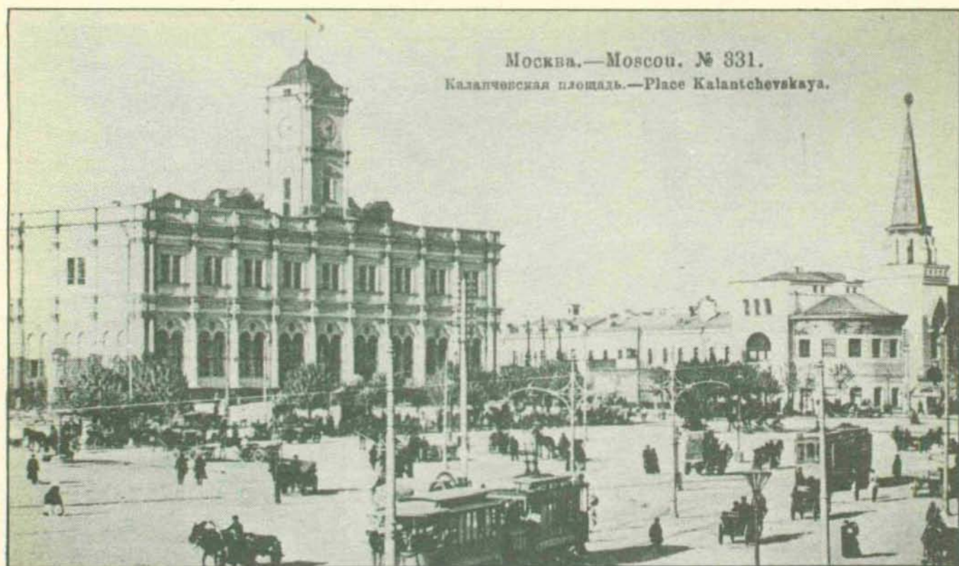
Москва.—Moscou. № 331. Каланчевская площадь.—Place Kalantchevskaya.