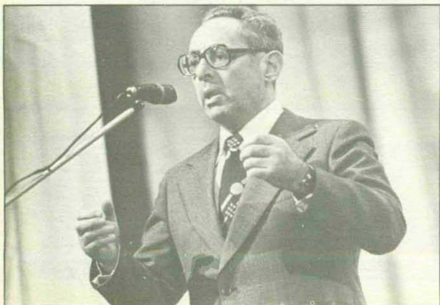
Resuena en el éter la voz mítica del locutor Yuri Levitan. (NOVOSTI).

En el proyecto de remodelación detallada de la parte vieja de la ciudad se prevé crear zonas vedadas en los lugares de mayor con-