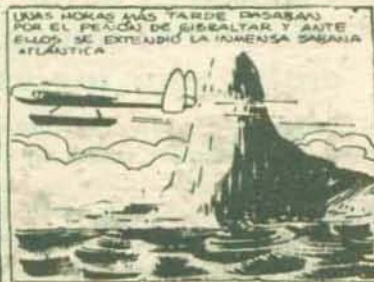
(Episodio de un «comic» publicado por «Odiel» de Huelva, durante el mes de enero de 1951.)