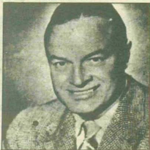
BOB HOPE, estrella de la Paramount, ha volado millones de kilómetros en los aviones Douglas. Dice que nada supera al DC-6 en velocidad y confort.

De acuerdo con una reciente investigación particular realizada DOUGLAS AIRCRAFT COMPANY, INC. SANTA MONICA, CALIFORNIA U.S.A.