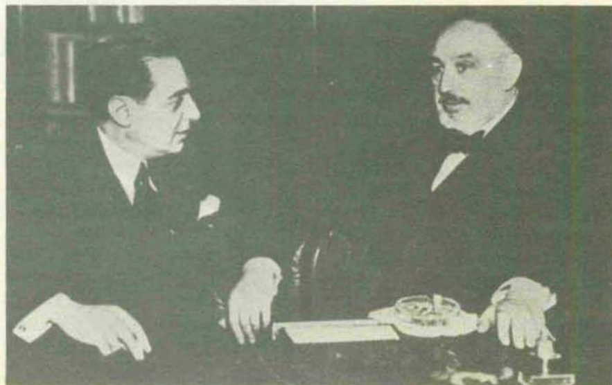
Los ilustres juristas Luis Jiménez de Asúa y Angel Ossorio y Gallardo.

fusilados, 4 presos y uno en paradero desconocido. Sobre la suerte individual de estos diputados tenemos muy pocas noticias y ninguna en la documentación de los archivos documentales de Salamanca. La explicación es muy sencilla dado que lo que ocurrió a los diputados en territorio controlado por