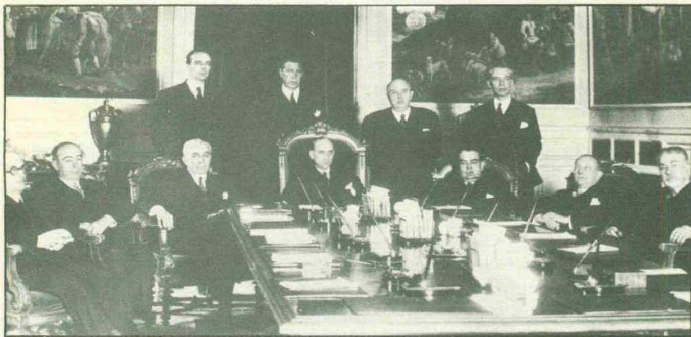
El Gobierno de Casares Quiroga (del 13 de mayo de 1936 al 19 de julio del mismo año). De izquierda a derecha, sentados: Antonio Velao Oñate (Obras Públicas), Enrique Ramos Ramos (Hacienda), Augusto Barcia Trelles (Estado), Santiago Casares Quiroga (Presidencia y Guerra), Manuel Blasco Garzón (Justicia), José Giral Pereira (Marina), Francisco Barnés Salinas (Instrucción Pública y Bellas Artes). De pie: Juan Lluh i Vallesca (Trabajo, Sanidad y Previsión Social), Plácido Álvarez-Buylla y Lozana (Industria y Comercio), Mariano Ruiz-Funes García (Agricultura) y Bernardo Giner de los Ríos García (Comunicaciones y Marina Mercante). Falta, en la foto, Juan Moles Ormella, ministro de la Gobernación.