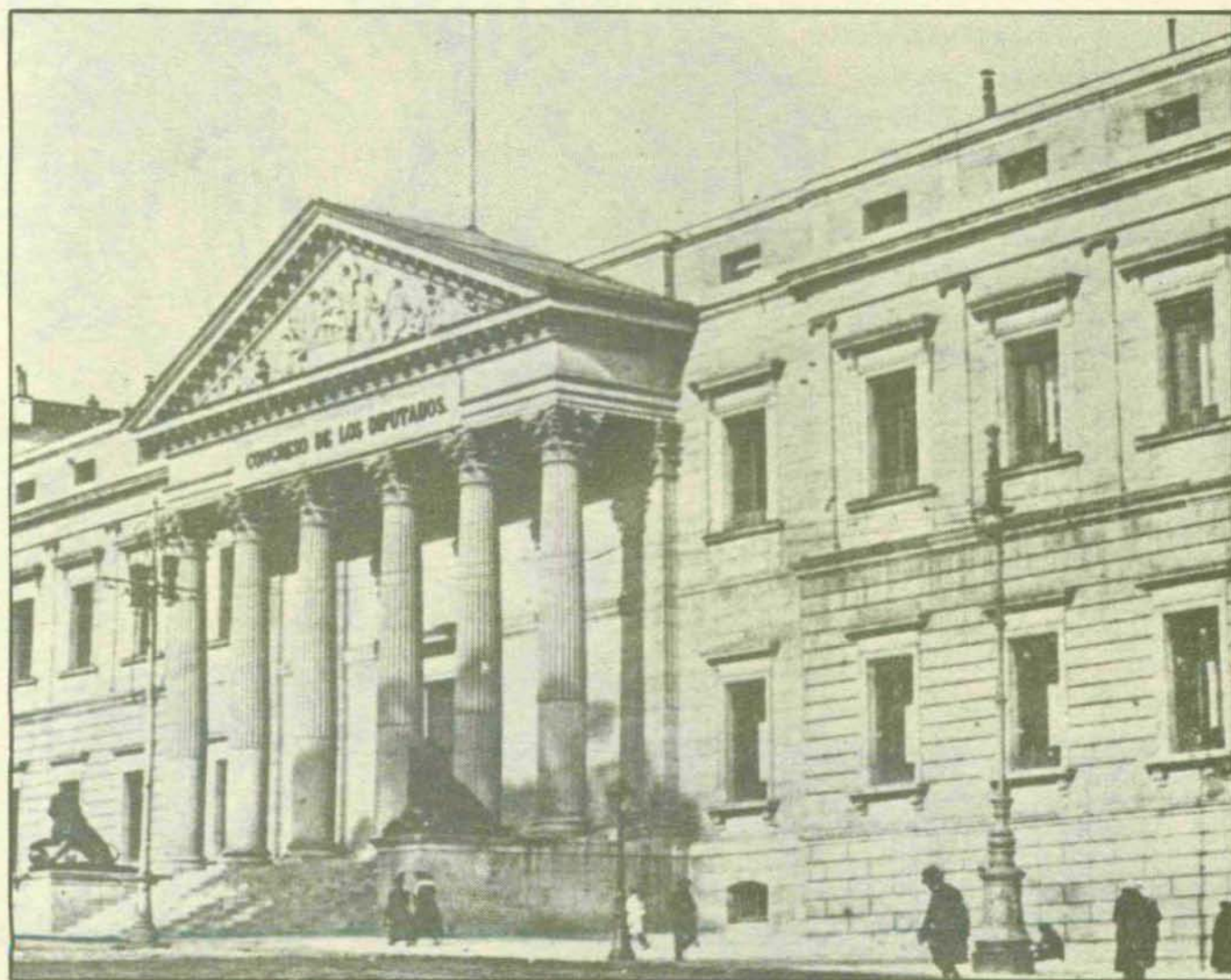
El Palacio del Congreso en vísperas de la guerra civil.

Los españoles de hoy hemos de empezar por asumir plenamente nuestra memoria histórica, que a todos pertenece, por encima de las facciones entonces en lucha. Sólo así podremos trabajar «en» el presente y mirar con esperanza hacia el futuro desde una sociedad democrática —que es casi tanto como decir civilizada— siempre perfectible, donde toda violencia, física o moral, no sea posible ni pueda, jamás, ser reivindicada. ■ A. R. T.