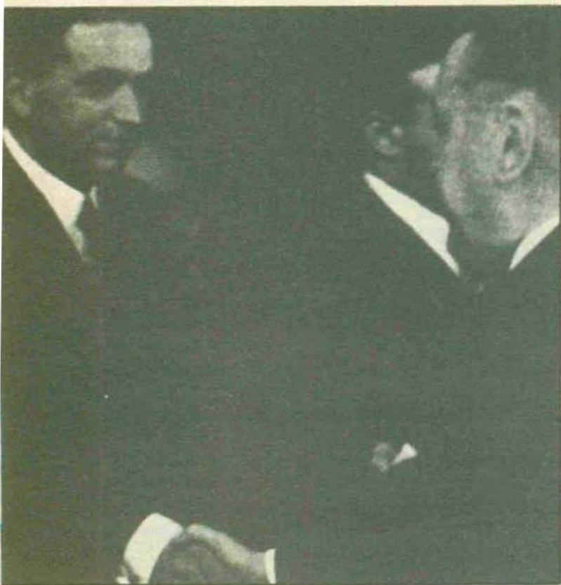
Jose Calvo Sotelo, líder de la oposición parlamentaria, saludando al presidente de las Cortes de la República, Diego Martínez Barrios, en vísperas de la guerra civil.