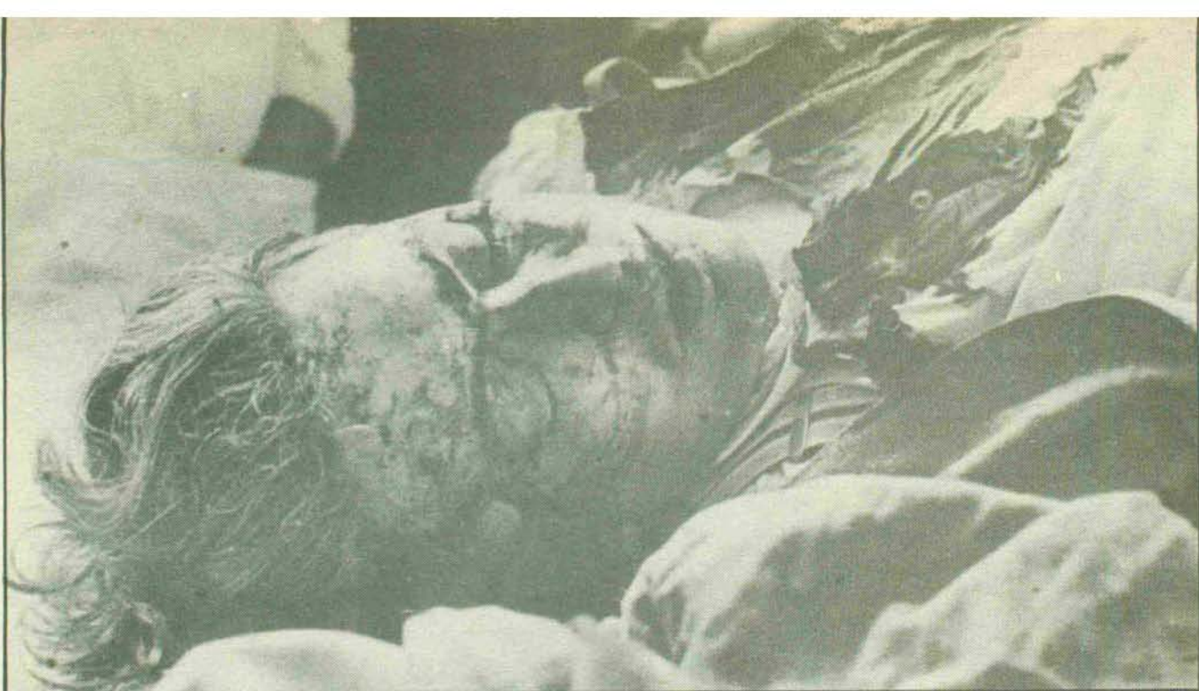
El cadáver de José Calvo Sotelo, en la morgue del cementerio madrileño de La Almudena. Su muerte fue uno de los desencadenantes de la guerra civil.

al señor Presidente del Consejo de Ministros» (30).