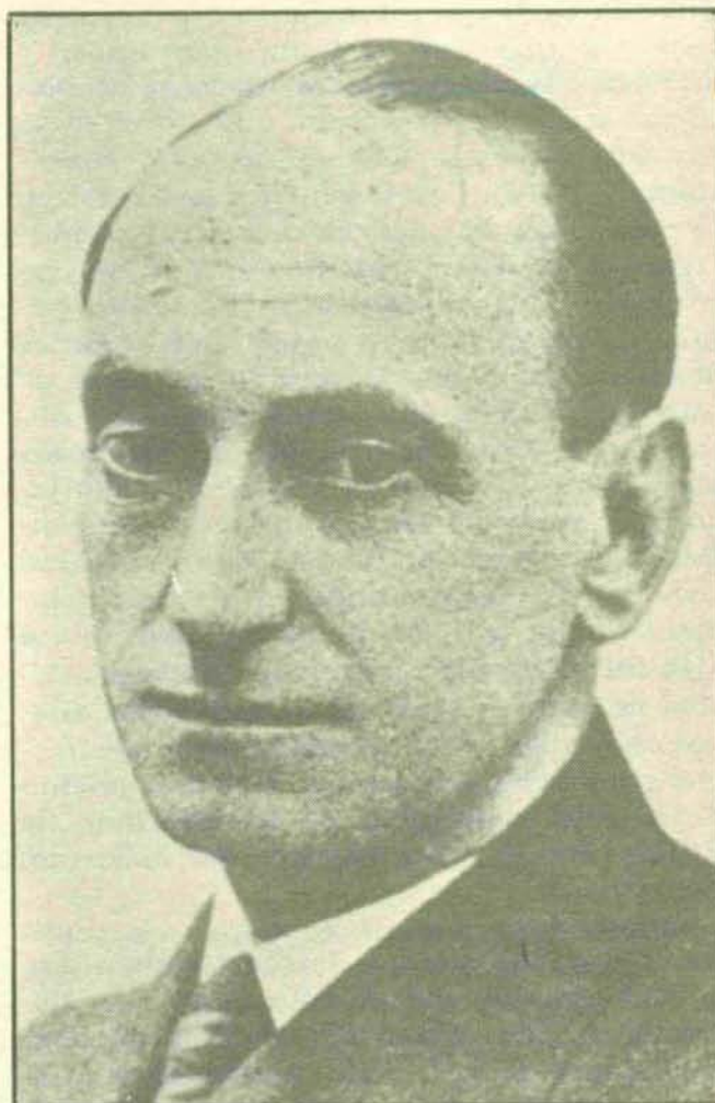
Santiago Casares Quiroga, presidente del Consejo de Ministros al iniciarse la guerra civil.

Popular, ha hablado como partido de semejantes poderes. Políticamente los rechazamos, porque son contrarios a nuestras doctrinas. Emplearlos sería, sencillamente, abrir el camino a la dictadura, y cualquiera que sea el placer que ello os cause a vosotros, sabed que yo, y todos mis compañeros de Gobierno, y estoy seguro de que todo el Frente Popular, siempre, cuantas veces se presente delante, iremos contra la dictadura» (17).