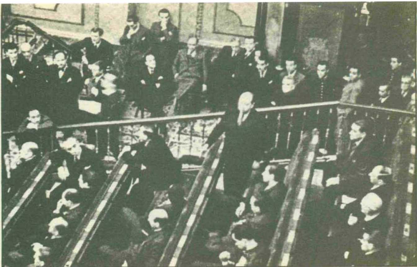
Un momento de la intervención de José M.ª Gil Robles, durante la sesión parlamentaria del 16 de junio de 1936. Detrás suyo, sentado en su escaño, José Calvo Sotelo.

no admiten otra calificación que la de irresponsable provocación. Actitud típica que el genio de Shakespeare inmortalizó en su obra «Julio César» (Actus Tertius, Scena secunda) en la contestación de Marco Antonio a Bruto tras el asesinato de Julio César, y que ha quedado como arquetípica de las infinitas posibilidades que ofrece la demagogia de manipular, en beneficio propio, el sentido de unas palabras, la significación de unos hechos, cuya interpretación era inequívoca.