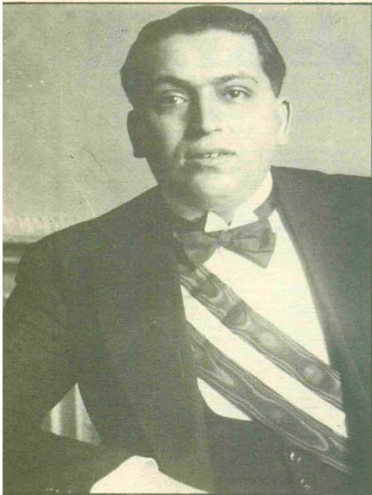
José Calvo Sotelo, una de las personalidades políticas más significativas de la derecha española. Murió asesinado en vísperas de la guerra civil.

El señor CALVO SOTELO: La traducción es libre, señor Presidente; la intención es sana y patriótica, y de eso es de lo único que yo respondo» (14).