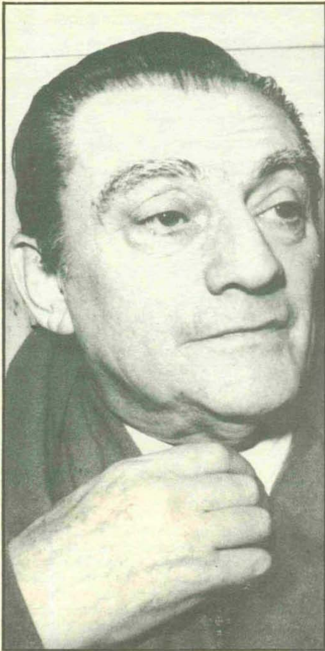
Luchino Visconti, duque de Modrone (Milán, 1906-Roma, 1976).