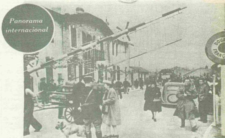
DEL CIERRE DE LA FRONTERA FRANCO-ESPAÑOLA Vista de la frontera en el lado francés de Hendaya