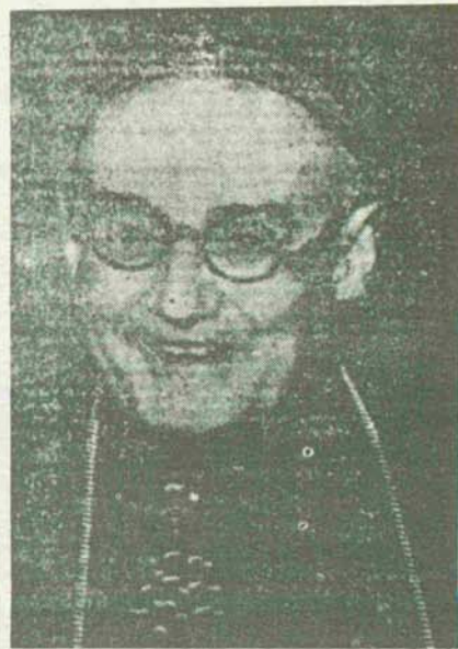
Monseñor Pla y Doda, Primado de las Españas

Bajo una lluvia fina llega al ayuntamiento nuestro Primado al Palacio de la Cruzada, en la plaza del Cuarte de Sarajia. Le hemos seguido desde el atrio y por el camino hemos tenido ocasión de saludarlo en un momento de su estancia en la diócesis española. Ante la preocupación por lo social, la fraternidad, la unidad y la ayuda que se presta, en los comienzos de nuestra Cruzada; Toledo, pastorales sencillas de verdad. Ahora, en Roma, discursos rebosantes de firmeza, frente a unos tiempos que se tambalean. Con el nuevo cardenal sacristán al llegar a Palacio las autoridades de Toledo, que han ido también a esperar a Sarajia. Alzando de un trazo ardiente que el doctor Pla y Doda nos dispuso siempre, hemos formado en el breve cortejo de una entusiasta y calurosa bienvenida. «Un hábil naipe» «Un hábil naipe» «Un hábil naipe»