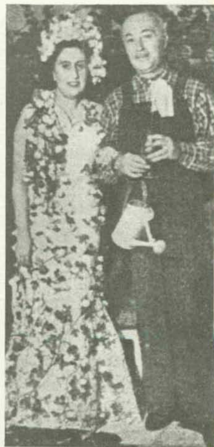
La señora de Covarrubias y el marqués de Luca de Tena.