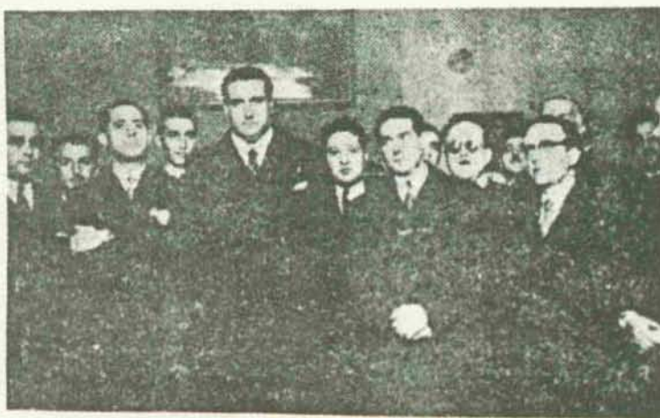
El ministro de Asuntos Exteriores, señor Martín Artajo, con los informadores de prensa, a quienes recibió en la tarde de ayer.

Manifestaciones del ministro de Asuntos Exteriores a los periodistas