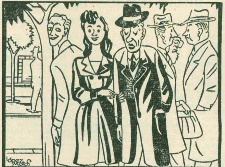
AL CABO DE LA CALLE, por López-Matos

7.º Restricción al 25 por 100 del consumo de los cafés, restaurantes, bares, tabernas, etcétera..., llevándose al límite máximo la reducción de consumo en los establecimientos de lujo que se conocen con la denominación de salas de fiestas, salones de té, bailes y similares, en los que se ejercerá rigurosa vigilancia, y caso de quebrantarse esta norma res-