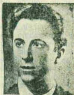
JUAN DE ORDUÑA