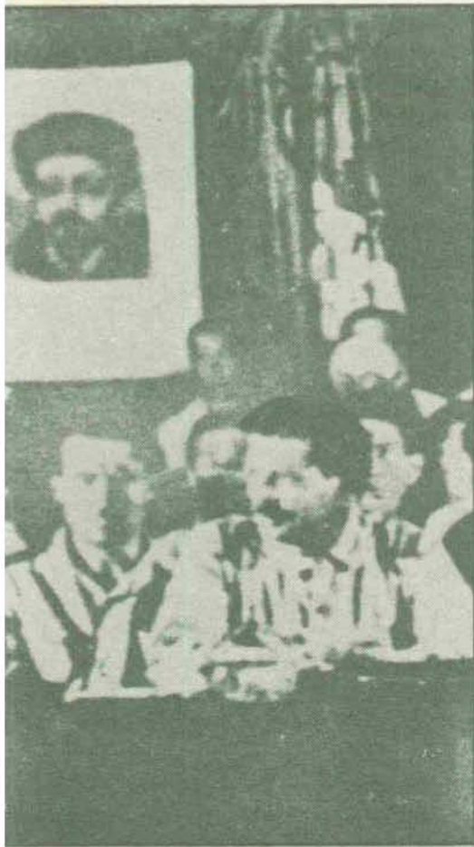
Trotsky habla en una reunión, en 1923. Stalin, en la extrema derecha, lo observa con ojos ya críticos... El 8 de diciembre de ese mismo año, Trotsky sería acusado por Zinóviev de traición.

cido, Sajarov, que trabaja desde la lógica científica dentro del marxismo. Finalmente, los eurocomunismos se enfrentan abiertamente con la URSS. La negativa de dejar hablar a Santiago Carrillo —secretario general del PCE, y el más audaz de los eurocomunistas— en Moscú ha contribuido a empañar la imagen aún más.