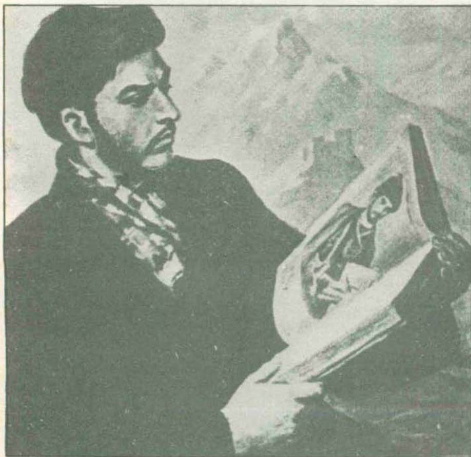
Esta imagen de Stalin en su juventud, obra pictórica de Toidze, que se conserva en la Galería Tretyakov, lo representa como un idealizado revolucionario, con la Antología de la Poesía Georgiana (su patria chica) en las manos.