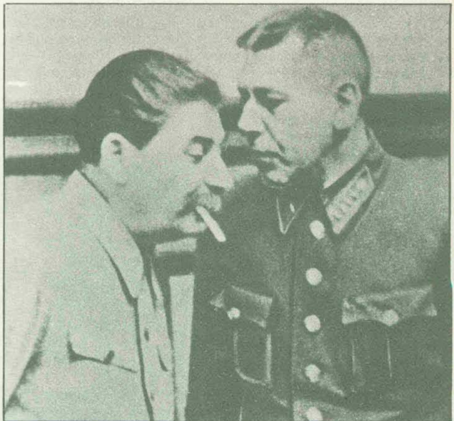
La participación personal de Stalin en la victoria sobre Alemania fue decisiva. Pero a la URSS le costó entre veinte y treinta millones de muertos. (En la fotografía, tomada en los primeros meses de la campaña contra el Reich invasor, aparece Stalin con el mariscal Chapochnikov, Jefe del Estado Mayor General de la Stavka).

pionaje americano con los aviones U-2—, autor de frases felices, metafórico, chistoso, provisto de un abundante repertorio de cuentos campesinos, simpático. Para estos conversos, para los que supieron suturar sus rasgaduras interiores, esperaban nuevas pruebas difíciles: además de la ruptura con China, los sucesos de Hungría y de Checoslovaquia —Praga cumple ahora diez años—. La represión política iba a ser menos cruel que en tiempos de Stalin: pero funcionan los manicomios en lugar de los campos de concentración, y los disidentes se encuentran con toda clase de condenas, desde la prisión hasta la muerte civil. Sobre el mundo iba a lanzarse una nueva ola de renegados. El más espectacular de todos —pero también el más fanático, el más loco verbal, el más irracional— Solyenitsin, que actúa sobre los supuestos de un cierto fascismo. El más lú-