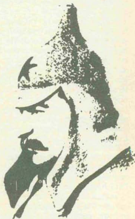
La imagen representa a Stalin durante la guerra civil y es obra de Moor. En este año de 1920, en que se firma el armisticio con Polonia, Stalin será elegido miembro honorario de la presidencia de los territorios y regiones autónomas soviéticas, en compañía de Lenin, Zinóviev y Trotski.

habían sido objeto de veneración —Trotski—, de ataques y matanzas a quienes habían sido protagonistas de la historia y del partido —los revisionistas, los desviacionistas—, de cambios bruscos de alianzas —el pacto germanosoviético—. Todo ello había producido huidas, decepciones, amarguras, abandonos, que nunca pasaron de ser movimientos masivos, y que la gran fuerza centrípeta de la guerra había tendido, si no a reunir, sí a paliar. La destalinización, palabra que apareció entonces por primera vez, iba a ser la primera de una serie de grandes divisiones y de roturas en el movimiento comunista internacional, continuando con la «diferencia ideológica» entre la URSS y China y la serie de sucesos que culminan ahora con el eurocomunismo. La gravedad de estas rasgaduras de conciencia es máxima: el comunismo se presentó desde el principio como un «socialismo cientifi-