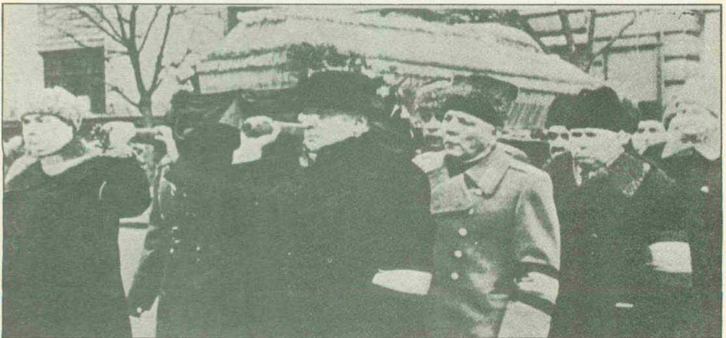
Stalin falleció en la madrugada del 2 de marzo de 1953, en Moscú. En la imagen, Malenkov, Beria, Voroshilov, Krutchev, Mikoyan y Suslov llevan el féretro hasta el Mausoleo de Lenin.

Esto es apenas una ficha biográfica. La apreciación psicológica, la apreciación política, son difícilmente aproximables todavía, a pesar de los cientos de biografías y de historias generales que se han escrito sobre Stalin, la URSS y el período histórico que engloba. Una tesis muy defendible es que condujo el comunismo hacia una forma de régimen que no estaba prevista por sus fundadores y sus ideólogos: una forma cruel, dictatorial, contraria a la libertad humana que trataba de defender. Otra fórmula también defendible es que con Stalin se consolidó el comunismo, la URSS se convirtió en una nación de primer orden, a partir