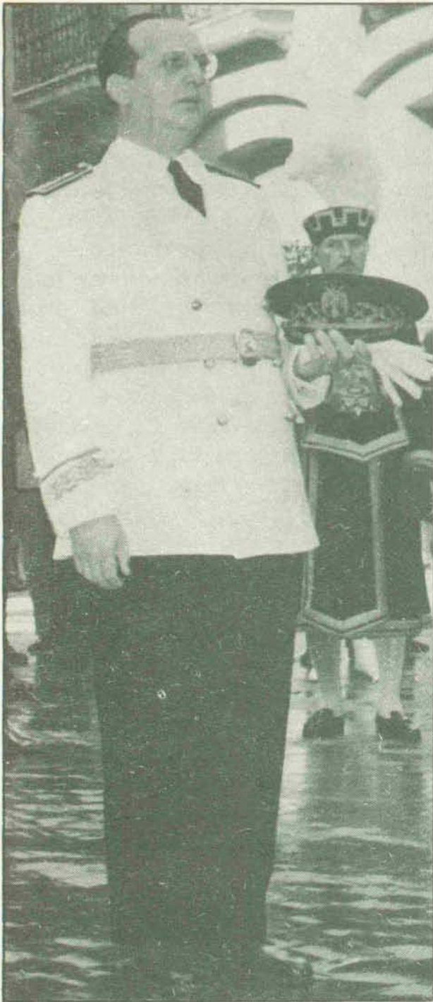
«La censura... Puede, si, que haga algún daño a las empresas y a los periodistas. Pero, a cambio, ¡hace tanto bien! Tengo datos concretos. Por ejemplo, desde que se implantó en España ha descendido vertiginosamente la masturbación...». (Palabras de Gabriel Arias Salgado, en la fotografía, Ministro de Información en 1953).

L A doctrina española en torno a la Unión Soviética estaba basada en estas ideas que procedían sin duda de un análisis concreto de la realidad, ajustado a unos datos: solamente que el punto de partida era enteramente erróneo y, por lo tanto, conducía hacia el desbarre. El punto de partida era el de que la URSS no era más que un inmenso territorio de nieve y barro, hundido en la pobreza, y que la doctrina comunista había