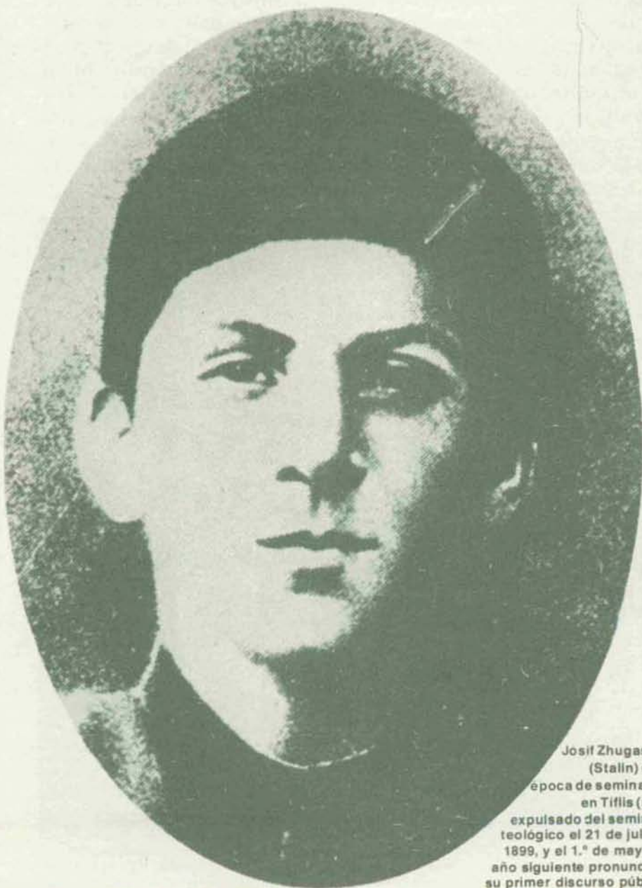
Josif Zhugashvili (Stalin) en su época de seminarista en Tiflis (sería expulsado del seminario teológico el 21 de julio de 1899, y el 1.º de mayo del año siguiente pronunciaría su primer discurso público.)

—Recientemente, me ha asombrado ver el poco interés que han dado ustedes a la noticia de la muerte de Stalin. Era un acontecimiento de primera magnitud, hubiera