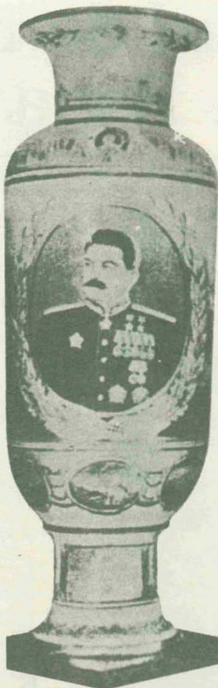
En el nivel popular, se multiplica la apología del jefe de los países comunistas: «un artístico producto del artesanado soviético».

Stalinismo, antistalinismo, destalinización, son palabras que tienen 25 años en estos momentos. Están vivas. Entre las dudas que surgen, hay una mantenida no sólo por los anticomunistas, sino por militantes o simpatizantes que han tenido que volverse reflexivos a la fuerza: si Stalin configuró el comunismo hasta darle la forma triunfante que conocemos en los países del Este, o si es el mismo sistema implantado por Lenin el que tenía que conducir indiscutiblemente a este extremo. En la separación del leninismo que, con todas las reservas y todo el prudente lenguaje necesario, va a decidir el IX Congreso del PCE en abril, hay ya una forma de acusación a que la desviación del comunismo original comienza con el propio Lenin. Será una discusión elucidadora, que se espera con el máximo interés, y que sin duda sobrepasará los niveles de simple oportunismo —ubicación del PCE en la forma predemocrática española— para alcanzar niveles tóricos. Hasta ahora, hay dificultad en discernir stalinismo de comunismo: los largos y espectaculares años de poder y su per-