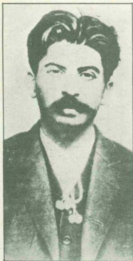
En 1913 (año de la fotografía), adoptaría el nombre de Stalin: «Hombre de acero». En este mismo año, Stalin participa en la conferencia bolchevique de Cracovia. El 7 de marzo se produciría el último arresto de Stalin, a quien en julio de este mismo año se deportaría a Siberia.

era sensible a lo que consideraba una exposición lógica. Y en estas exposiciones lógicas en forma de novela o de reportaje, en todo caso de testimonio, se describían los crímenes de Stalin. Un continente que salía de una dictadura terrorífica dudaba de la posibilidad de que le alcanzase otra dictadura terrorífica. Y la figura de Stalin, desde el anticomunismo; oscilaba entre todas estas características: el Anticristo, el Demonio mismo, un aliado del Demonio; un loco, un vesánico, un asesino; o el representante máximo de una doctrina cruel y totalitaria.