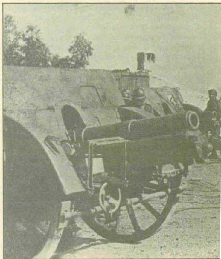
Se le ordenó trasladarse a Málaga para organizar su defensa como comandante militar en críticos momentos: (En la imagen, las tropas italianas a las puertas de Málaga).