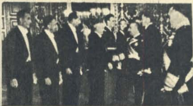
El Caudillo estrecha la mano a los agraciados pertenecientes a la Embajada de los Estados Unidos, que le presentan el nuevo embajador.