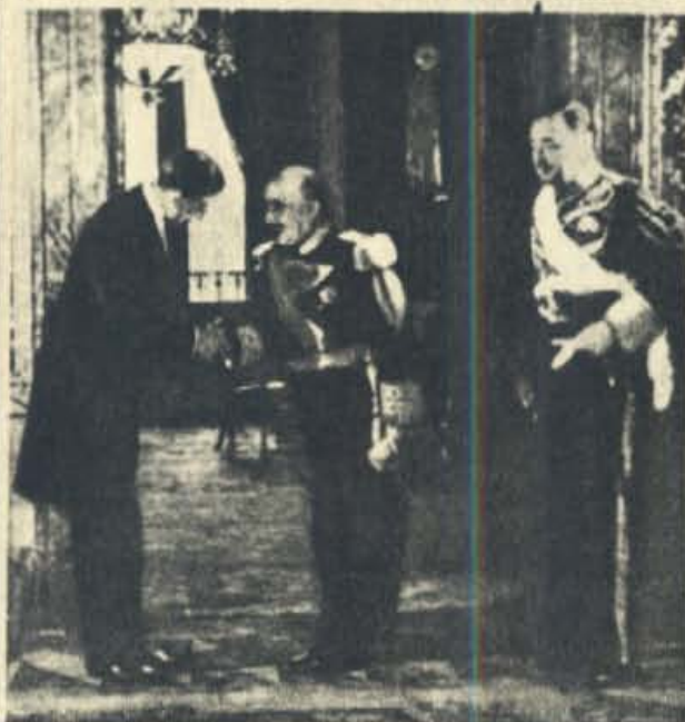
Madrid. El jefe del Estado y Generalísimo de las Armadas, acompañado por el ministro de Asuntos Exteriores, Sr. Izquierdo, recibe al nuevo embajador de los Estados Unidos, Sr. Norman Armour, después de la presentación de sus cartas credenciales.