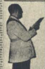
Señor de las Torres, gobernador de Castellón, en el momento de su llegada al aeropuerto de Barajas.

En el momento de su llegada al aeropuerto de Barajas, en el momento de su llegada al aeropuerto de Barajas, en el momento de su llegada al aeropuerto de Barajas.