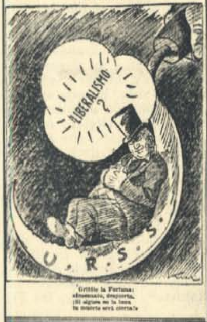
Grítale la Fortuna: «¡Despierta, despierta, si alguien en la luna te quiere verá cierta!»