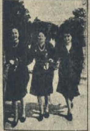
Una procesión de Jueves Santo en Madrid. Se ven a las mujeres que llevan el Santo Sepulcro.