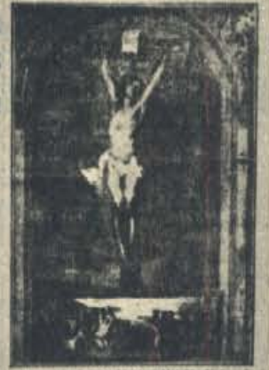
CRUCIFIXIÓN DE CRISTO EN LA IGLESIA DE SAN JUAN

Extraordinaria emoción piadosa en Madrid. Millares de fieles conmemoran la institución del Sacramento de la Eucaristía y desfilan en las procesiones. La procesión del Rosario de la Encarnación, que sale a las 10 de la mañana, es la más numerosa. Después de ella se celebran las procesiones de la Pasión y del Cristo de la Buena Muerte. En la tarde, a las 8 de la noche, se celebra la procesión del Santo Sepulcro, que es la más solemne de todas. En esta procesión se lleva el Santo Sepulcro, que representa el cuerpo de Cristo, en un ataúd que se cubre con un velo negro. Los participantes van vestidos de negro y llevan velos. La procesión termina a las 10 de la noche con la lectura del Evangelio de San Juan.