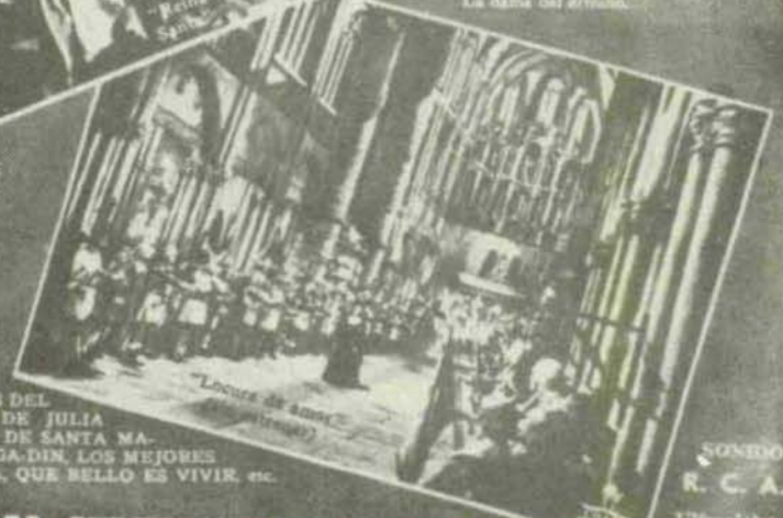
"Locura de amor" (doblada)

PAFLO BILL, EL TILO LA NAVAJA A TRAVES DEL "EJO, VIDA INTIMA DE JULIA ERIS, LAS CAMPANAS DE SANTA MA- RI, VIVIR EN PAZ, GUNGA-DIN, LOS MEJORES DAYS DE NUESTRA VIDA, QUE BELLO ES VIVIR, etc.