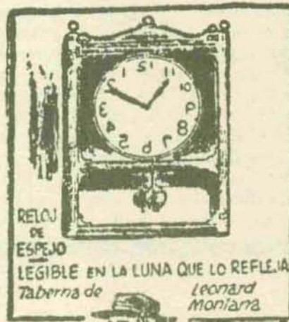
RELOJ DE ESPEJO

LEGIBLE EN LA LUNA QUE LO REFLEJA Taberna de Leonard Montaña