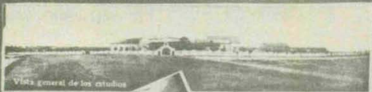
Vista general de los estudios