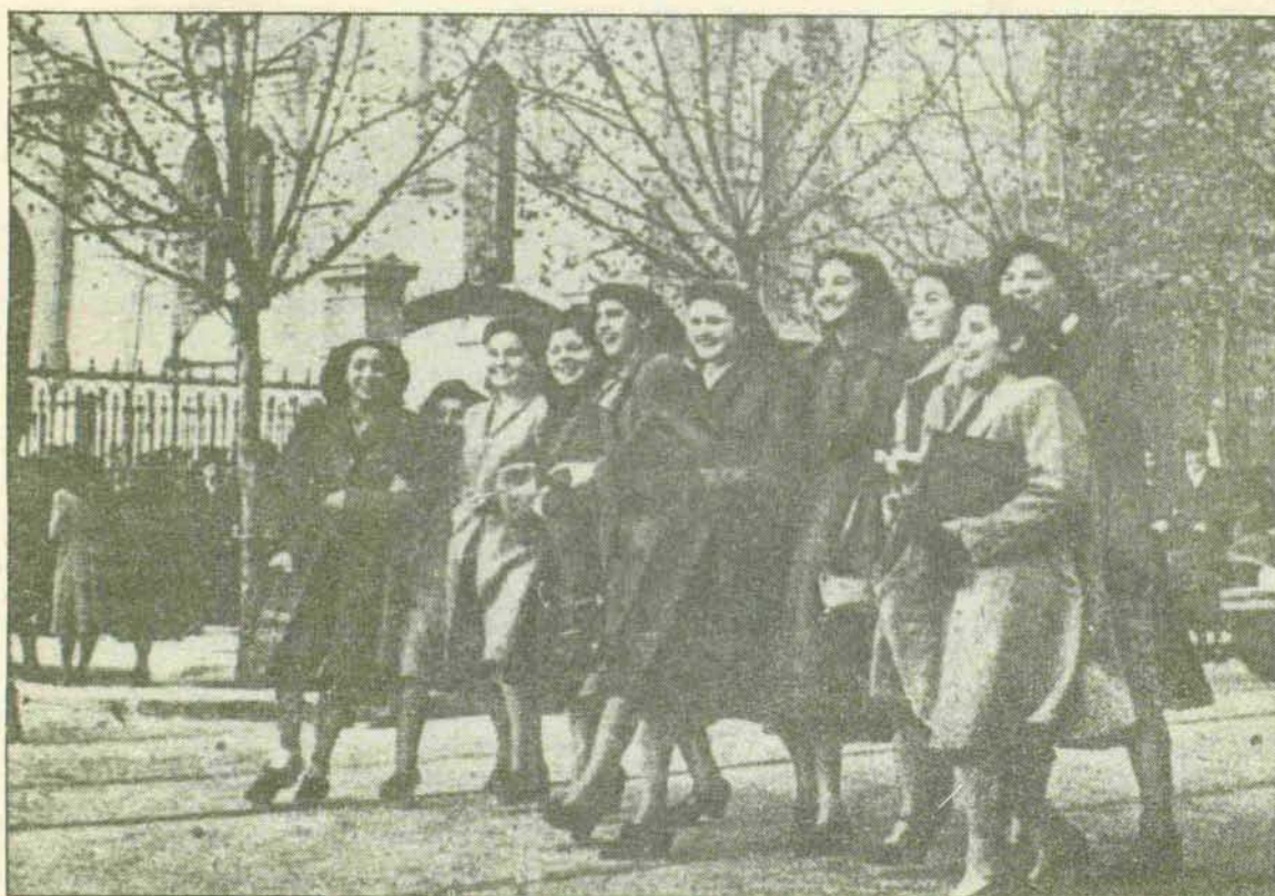
Organizado por el Sindicato Provincial Textil y la Hermandad de Santa Lucía y con motivo de la festividad de la Patrona de los gremios de la Confección, se celebraron ayer varios actos, entre ellos una misa en la iglesia del Buen Suceso, a la que asistió la hija del Jefe del Estado, señorita Carmen Franco Polo, que aparece en nuestra fotografía a la salida del templo, rodeada de modistillas madrileñas.