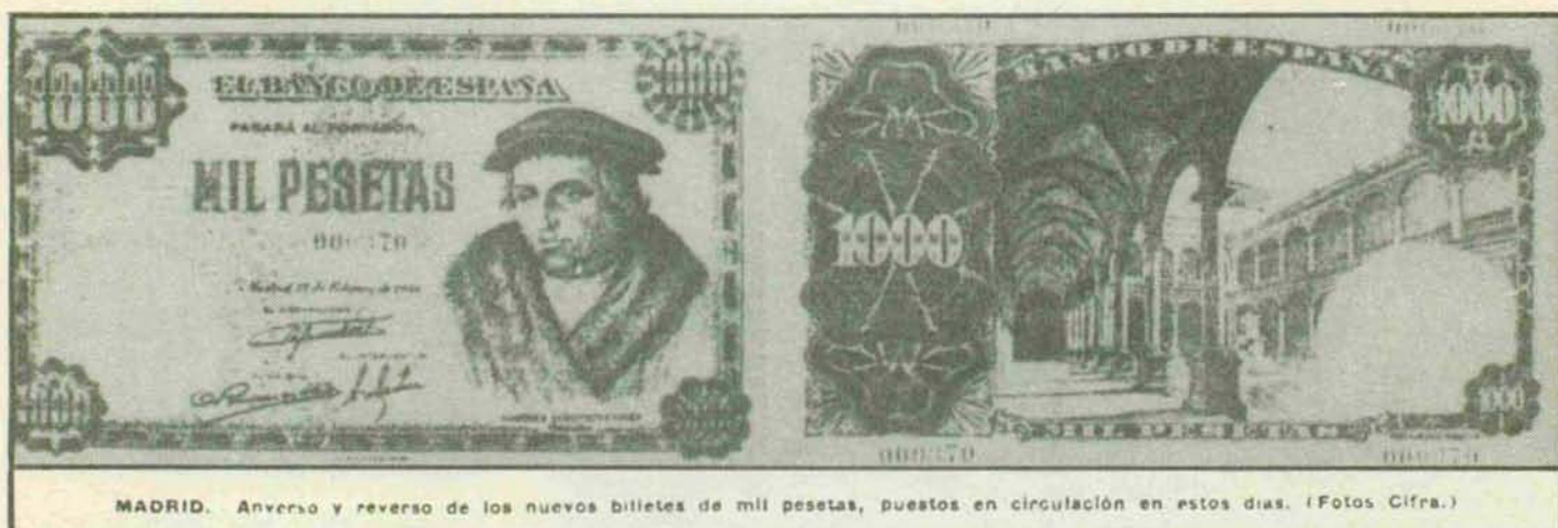
MADRID. Anverso y reverso de los nuevos billetes de mil pesetas, puestos en circulación en estos días.