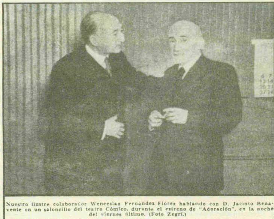
Nuestro ilustre colaborador Wenceslao Fernández Flórez hablando con D. Jacinto Benavente en un saloncillo del teatro Cómico, durante el estreno de "Adoración", en la noche del viernes último.