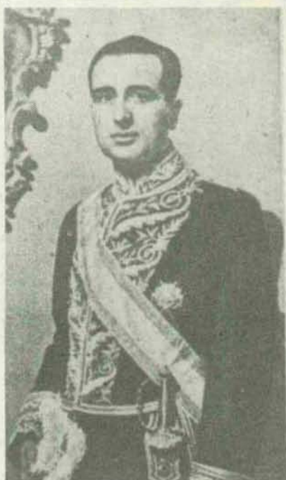
Don Joaquín Ruiz Jiménez, nuevo embajador de España en el Vaticano, que presentó el domingo por la mañana sus cartas credenciales a Su Santidad el Papa.

Ya se halla en Washington la señora de Chang Kai Chek, con la pregonada intención de pedir inmediata ayuda a los Estados Unidos. Tenemos la impresión de que la señora Chang Kai Chek, que durante su es-