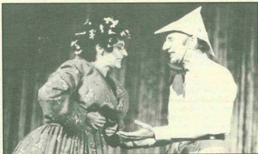
Conchita Velasco y Adolfo Marsillach en una escena de "YO ME BAJO EN LA PROXIMA, ¿Y USTED?".