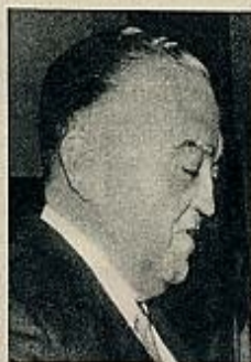
HOOPER, MEDIO SIGLO ESPIANDO.

Existe una fuerte campaña para que J. Edgar Hoover dimita de su puesto de director del FBI, en el que lleva cuarenta y cinco años. Precisamente este largo período se esgrime como una razón para que dimita: un hombre que, desde hace casi medio siglo, espía concienzudamente a los demás, con todos los medios técnicos y humanos puestos a su alcance, conoce tantos secretos políticos que es exageradamente peligroso. «En muchos aspectos —escribe el «Washington Post»— ha servido al pueblo de los Estados Unidos con habilidad, y merece su gratitud. Pero hace ya mucho tiempo que debía haber ofrecido su dimisión. Nadie dejará de reconocer la impropiidad y el peligro que representa el que quien ha transcurrido cuarenta y cinco años como dirigente de una organización de investigación de secretos mantenga un cargo tan poderoso y tan cargado, en el que puede hacerse peligrar a personas libres». J. Edgar Hoover se hizo cargo del FBI en 1924, cuando tenía veintinueve años (tiene ahora setenta y cuatro). Hoover le dio un tono austero y casi monacal: soltero, casto y abstemio,