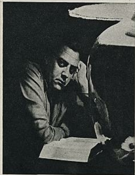
Tiene unos ojos soñadores e inquietos y su apariencia recuerda la de un "boxer" excesivamente triste

Pero su peso ha permanecido constante. Claro está que sus ojos no dejan de observar cada mañana la diminuta báscula instalada en su cuarto de baño.