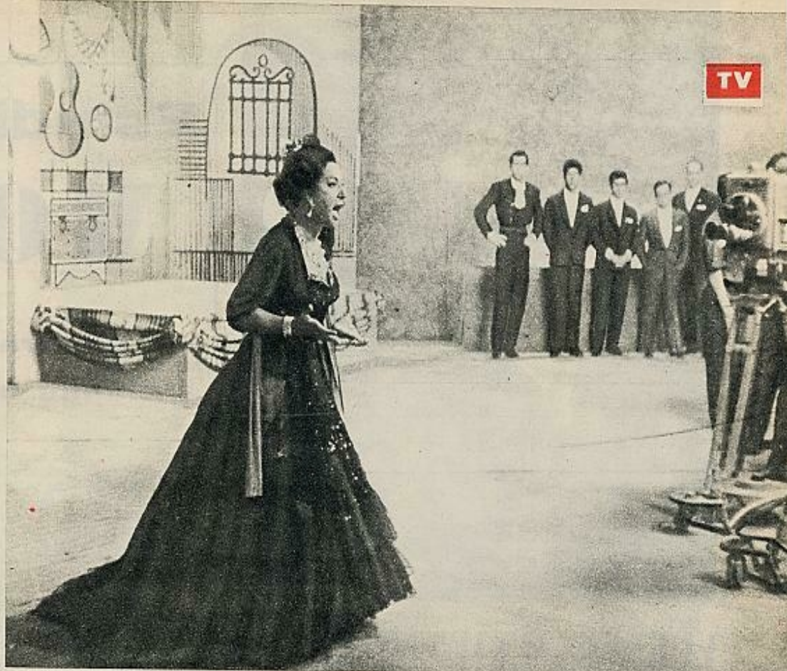
Lola Flores elevó el nivel del programa a su más alta tensión. Después del madison, el gran arte del «terremoto gitano»

• La TVE ha fletado ya su carga para la temporada. Con algunas modificaciones que se harán sobre la marcha, ha puesto el "Completo". Algunos de los programas son los mismos..., con distinta etiqueta. Pero eso no importa. Si los guionistas y los realizadores tienen imaginación, a lo mejor resulta un buen año.