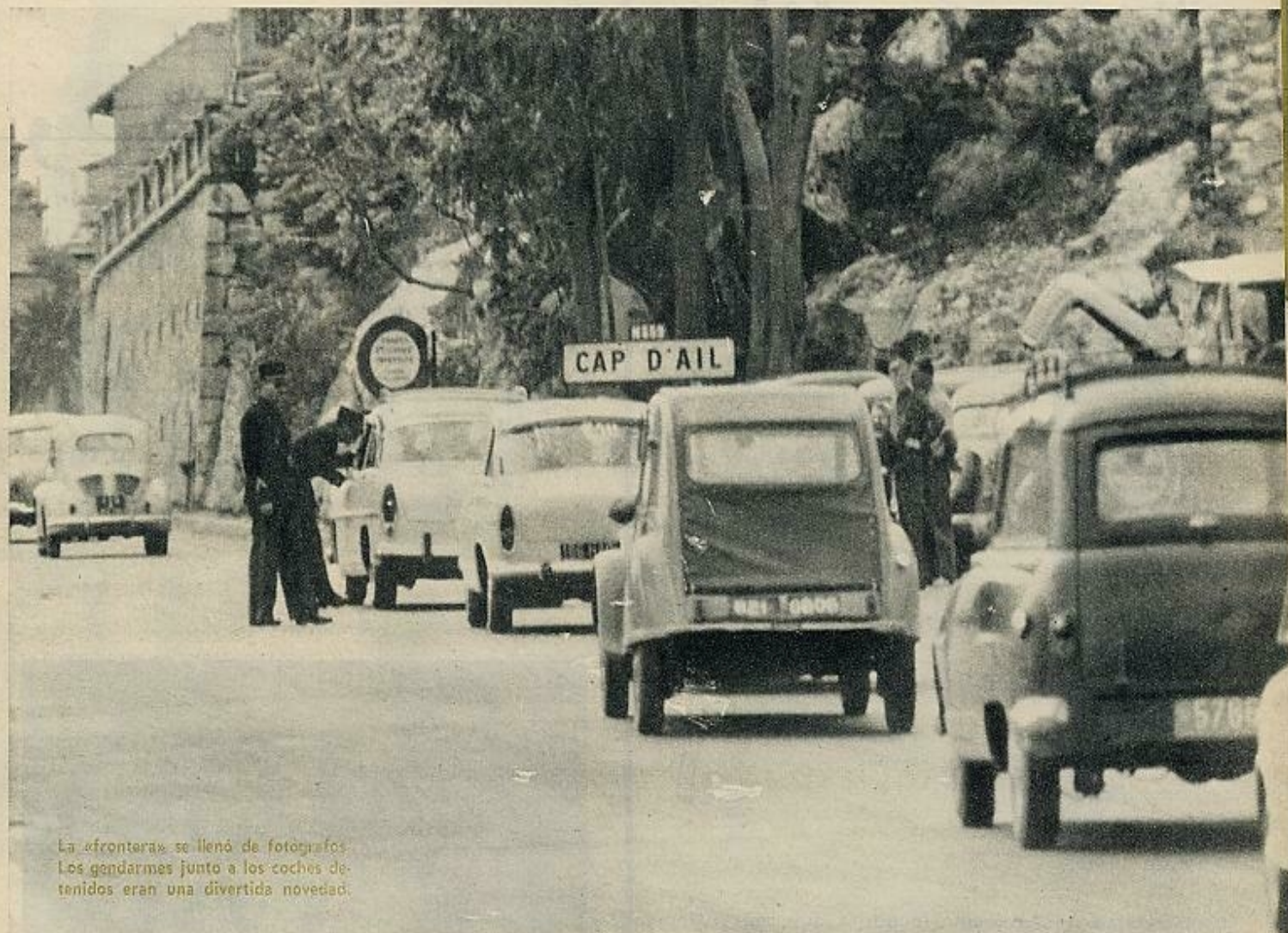
La «frontera» se llenó de fotografías. Los gendarmes junto a los coches detenidos eran una divertida novedad.

T ODO sería como una opereta si el argumento fuese sentimental. Pero la verdad es que la querrela entre Francia y Mónaco, aunque tenga por medio a personajes tan decorativos como el Príncipe Rainiero, la delicada Grace y el enérgico De Gaulle —muy en línea de los viejos actores de carácter de las compañías teatrales—, es una querrela puramente económica. «Cherchez l'argent», en lugar del «Cherchez la femme». Porque Francia se queja de que una gran cantidad de sociedades eluden los impuestos domiciliándose en Mónaco. Y Mónaco aduce que tienen perfecto derecho a hacerlo y que gracias a ello el Principado goza de una placentera prosperidad.