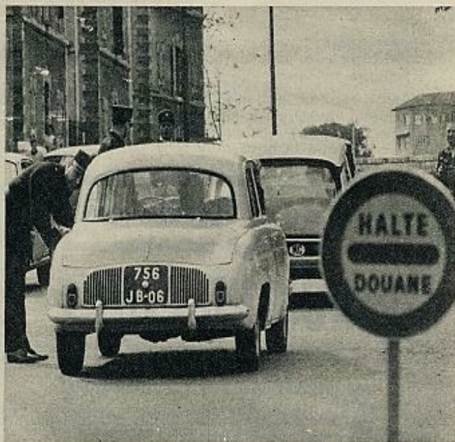
¿Tiene algo que declarar?... ¿Qué ocurre? Paso por aquí todos los días.

Una cosa es segura: Mónaco seguirá siendo un delicioso país sin servicio militar.