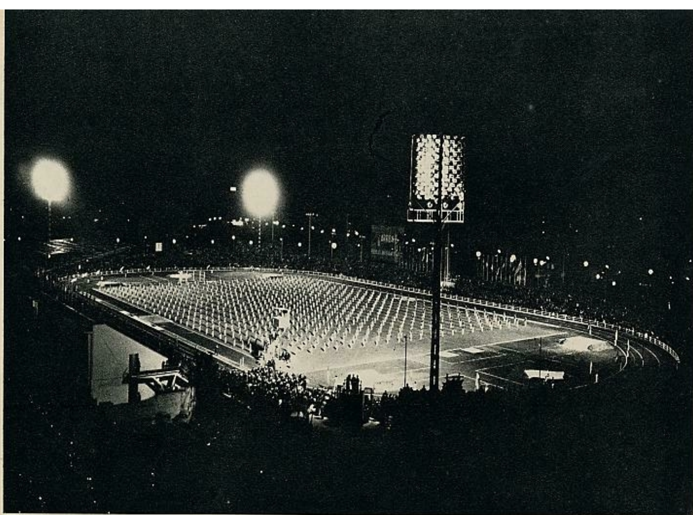
En la tarde del Día de la Hispanidad, S. E. el Jefe del Estado clausuró los II Juegos Atléticos Iberoamericanos. El Caudillo entregó las medallas a los vencedores de la jornada. Después hubo una exhibición gimnástica, educativa y rítmica. Más tarde actuó una masa coral y, por último, se encendió un gran cartel con la inscripción «Arriba, Pueblos Iberoamericanos». El estadio de Vallehermoso, repleto de aficionados, ofrecía, ya entrada la noche, la fantástica perspectiva que ofrecemos.

En este gráfico ofrecemos un estudio comparativo de las marcas registradas en los I Juegos Atléticos Iberoamericanos y las obtenidas en los recientemente celebrados en Madrid. Los nombres de los atletas y su nacionalidad se refieren únicamente a estos últimos. Las cifras dadas entre paréntesis corresponden a los puntos de cada marca según la tabla sueca en vigor. Como referencia señalamos bajo las iniciales R. M. y R. O., los récords mundiales y olímpicos respectivamente. Aquéllos son únicamente los homologados por la Federación Internacional hasta primeros de este año, ya que, aunque algunos han sido superados en la presente temporada, aún no han sido consignados oficialmente.