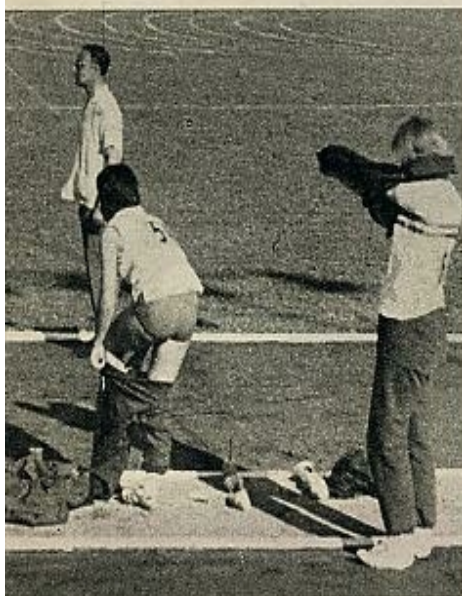
americanos. En estas pruebas se echó de menos la presencia y actuación de las atletas españolas

público, al tiempo que descubría el atletismo, lo ha entendido y comprendido. No ha ido ese público solo a ver ganar a los españoles y a los ases jaleados o famosos de otros países. Los errores, los defectos técnicos, las buenas marcas, e incluso las decisiones de jueces y jurados, poco acordes con un reglamento que casi era griego o chino hasta entonces para la masa, han sido captadas, aplaudidas o censuradas con criterio justo y entendimiento exacto. Saben ya esos espectadores cuándo un lanzador de jabalina lanza mal, aunque consiga buenas marcas; adivinan, o mejor dicho, prevén que un saltador de altura o de pértiga va a derribar el listón antes de llegar a él; saben distinguir si el ritmo de un corredor es el más apropiado para la distancia que ha de cubrir y son capaces de matizar en su mayoría cuándo los obstáculos son bien franqueados y cuándo el error de un juez los sitúa equivocadamente sobre la pista. Han aplaudido esos espectadores a los españoles que les deparaban satisfacción con la misma intensidad que a los de otros países que les ofrecían actuaciones