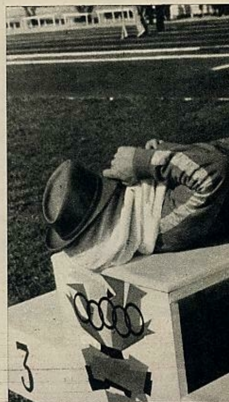
Sobre el pódium de los vencedores, y en postura excesivamente cómoda, un miembro del equipo