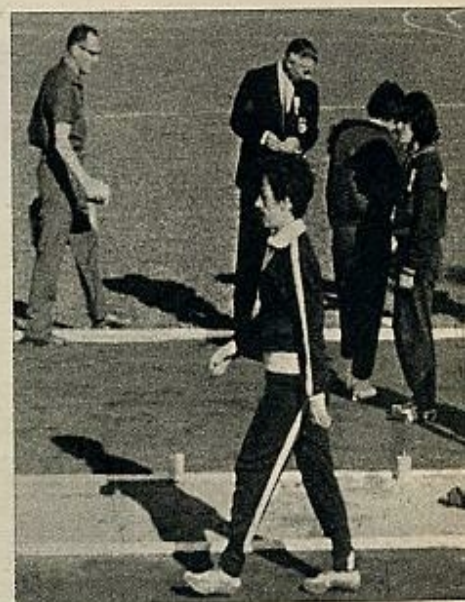
Las participantes femeninas durante una de las pruebas clasificatorias de los II Juegos Ibero-