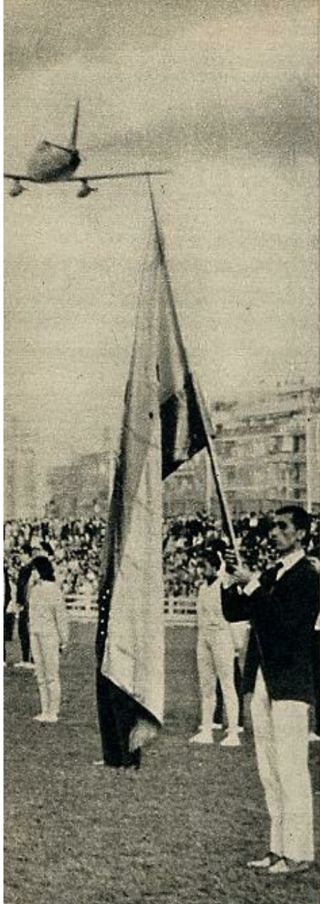
césped del estadio de Vallehermoso el día de la apertura. En el cielo madrileño, varios aviones