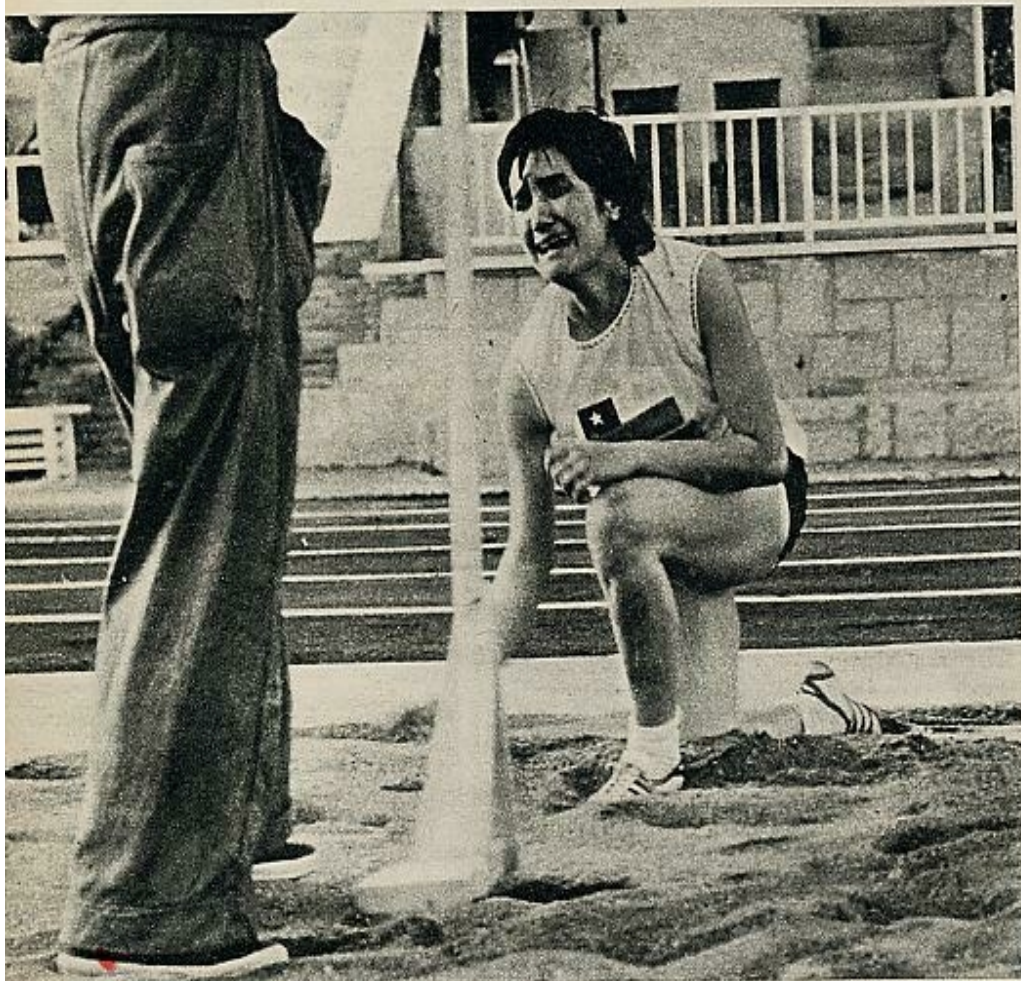
El dolor de lo irremediable se transforma en desconsolado llanto. Esta joven chilena realizó tres saltos de longitud nulos, quedando descalificada. Ella pudo llorar; las españolas, brillaron por su ausencia

nados, sin que la desidia, la rutina o la dejadez la apaguen.