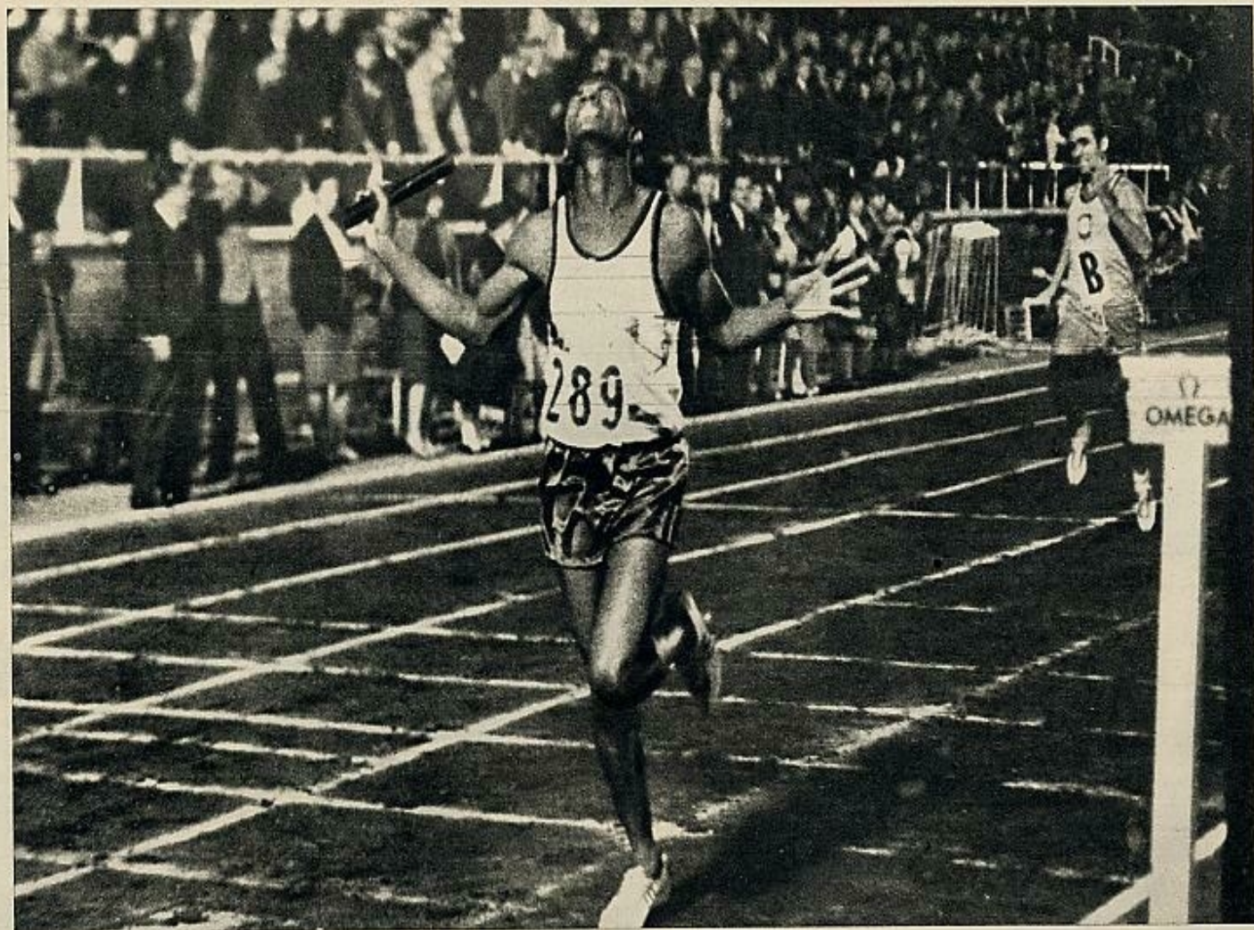
En atletismo, la prueba de los 4 x 400 es una de las consideradas como fundamentales. La apoteosis del triunfo se centra en la desgarrada expresión de esfuerzo del atleta venezolano Hortensio Fucil al romper la cinta de llegada