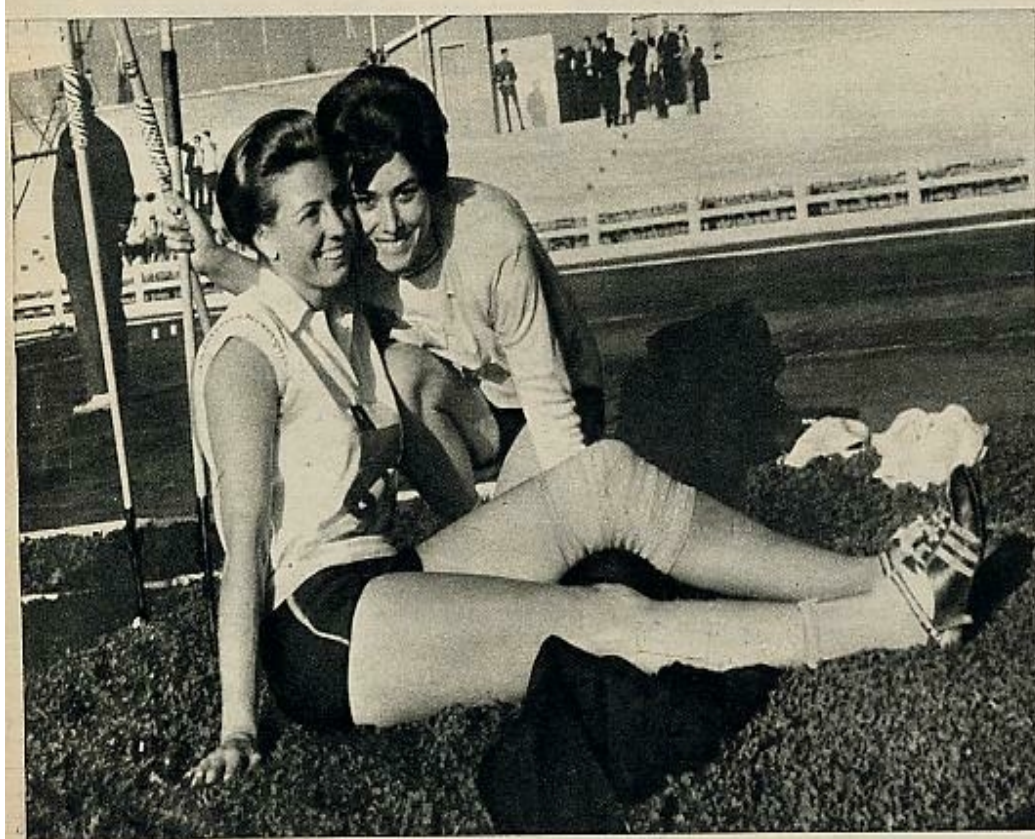
La belleza, como demuestra la foto, no está reñida con el deporte. La chilena Marlene Ahrens, casada y madre de dos niños, descansa en compañía de otra participante después de triunfar con la jabalina