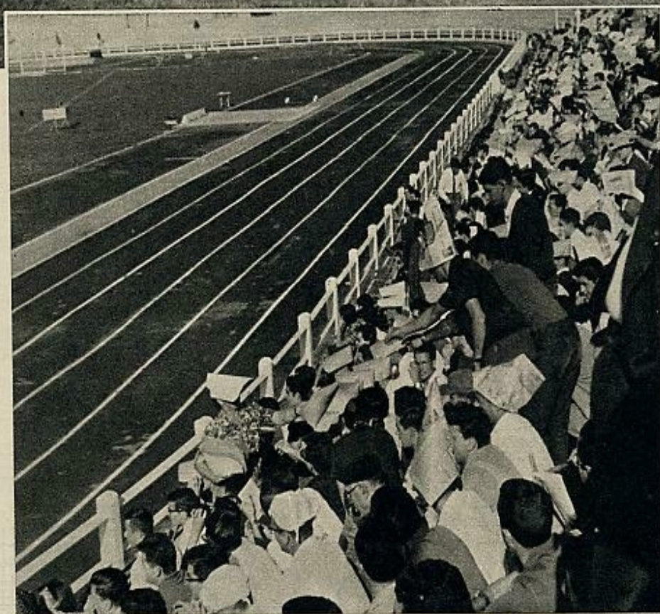
Por primera vez, al menos durante muchos años, el atletismo fue en Madrid un deporte popular. Las gradas del campo de Vallehermoso se llenaron de un público que desafiaba al sol con pañuelos y periódicos