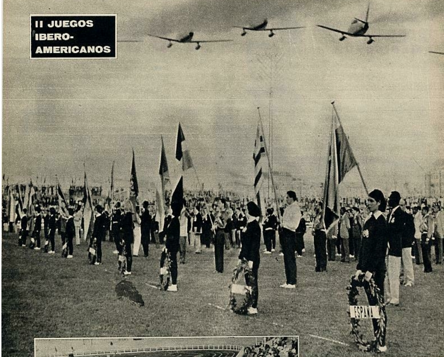
Los dieciocho equipos participantes en los II Juegos Atléticos Iberoamericanos, formados sobre el