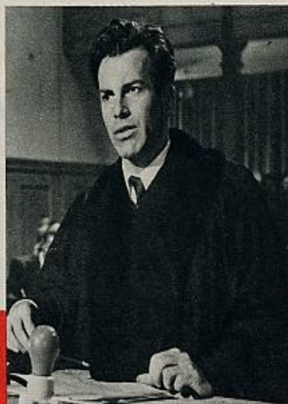
Maximilian Schell en «Vencedores o vencidos».