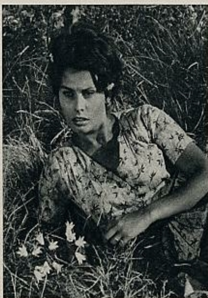
Sofía Loren en «Dos mujeres», de Vittorio de Sica.