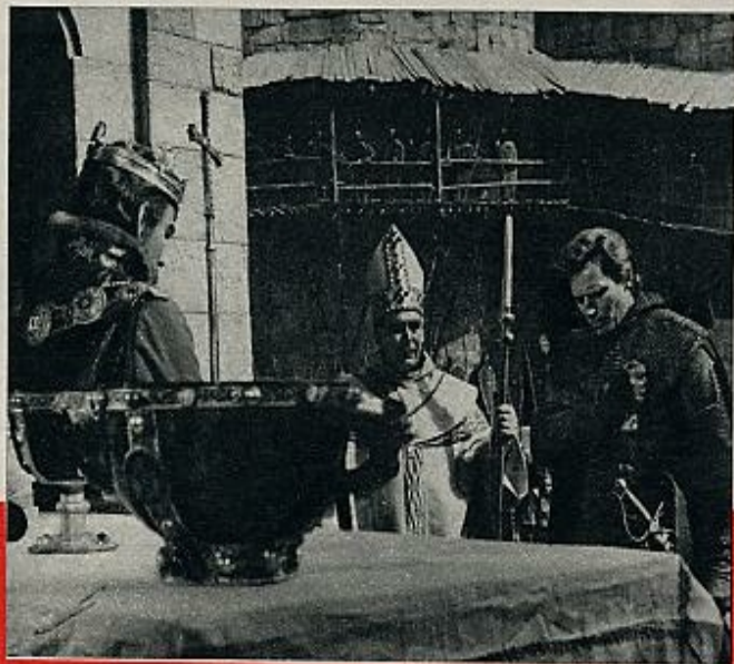
«El Cid», dirigida por Anthony Mann.