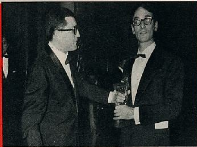
Muchas ovaciones, especialmente en las localidades altas. Carlos Saura —el gran director de «Los golfos»— recoge de Bardem la estatuilla concedida a Zurlini.