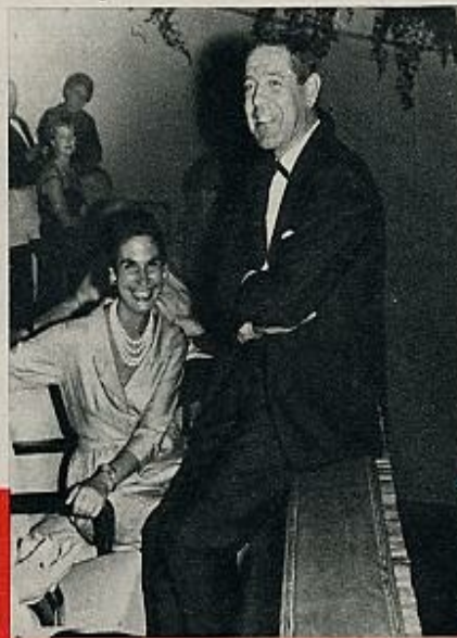
Luis García Berlanga, director de «Plácido».