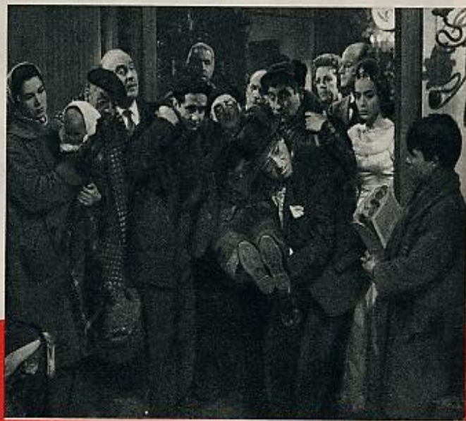
«Plácido», dirigida por Luis García Berlanga.