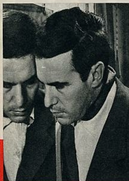
Francisco Rabal en «A las cinco de la tarde».