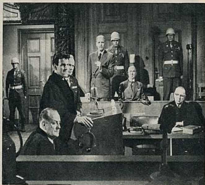
«Vencedores o vencidos», dirigida por Stanley Kramer.