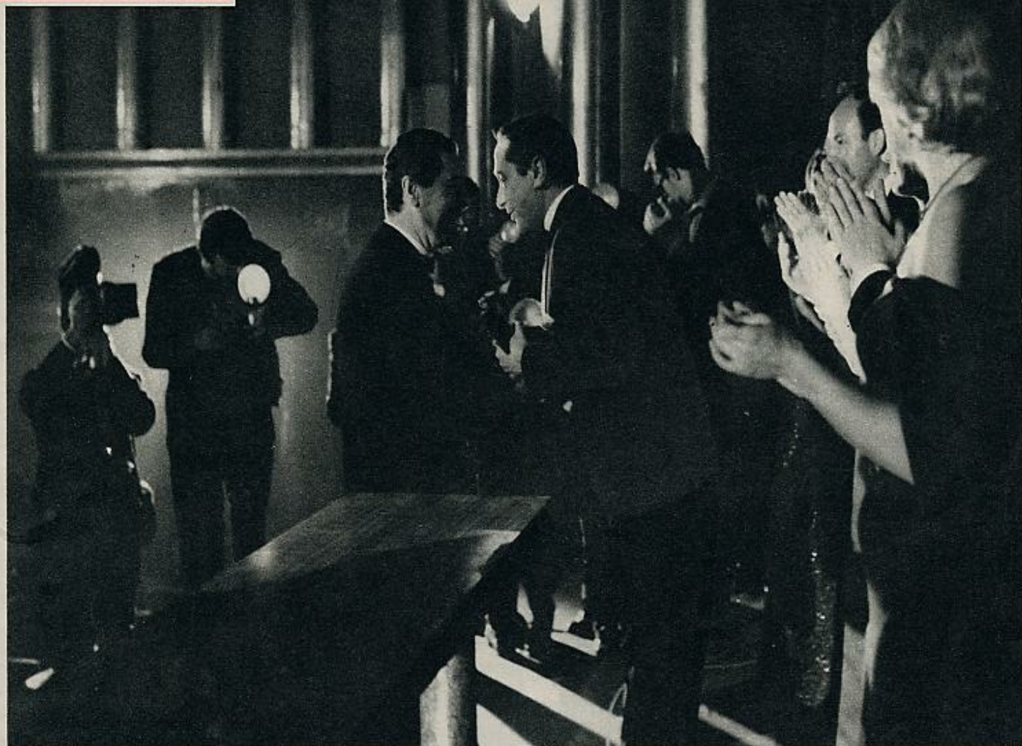
Ardavín, premio al mejor director el año 1960, felicita a Luis G. Berlanga, galardonado el año actual. Sus compañeros, alineados en el escenario del cine Capitol, aplauden calurosamente al realizador de «Plácido», uniéndose a una de las más entusiastas ovaciones del público, que llenaba absolutamente las localidades del cine.