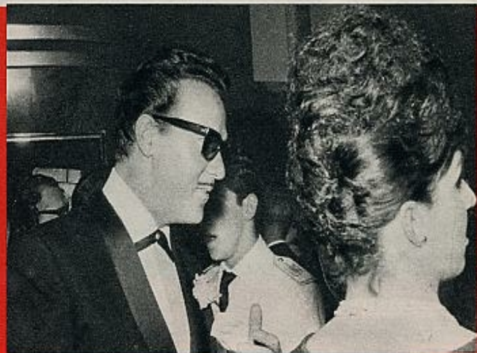
Uno de los ganadores del premio a Los Mejores, en ediciones anteriores, es el galán hispano-portugués Antonio Vilar, que, naturalmente, también estaba allí...