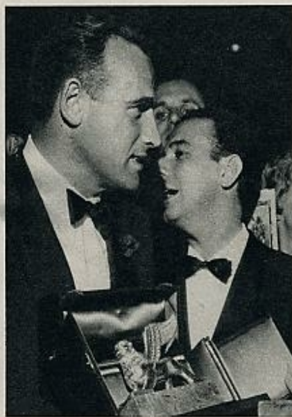
Valerio Zurlini, director de «La chica con la maleta».