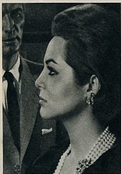
Sara Montiel en «Pecado de amor», de Amadori.