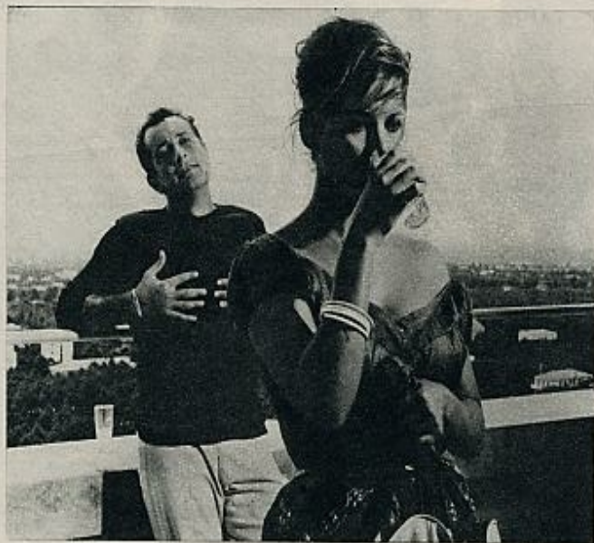
«La chica con la maleta», dirigida por Valerio Zurlini.