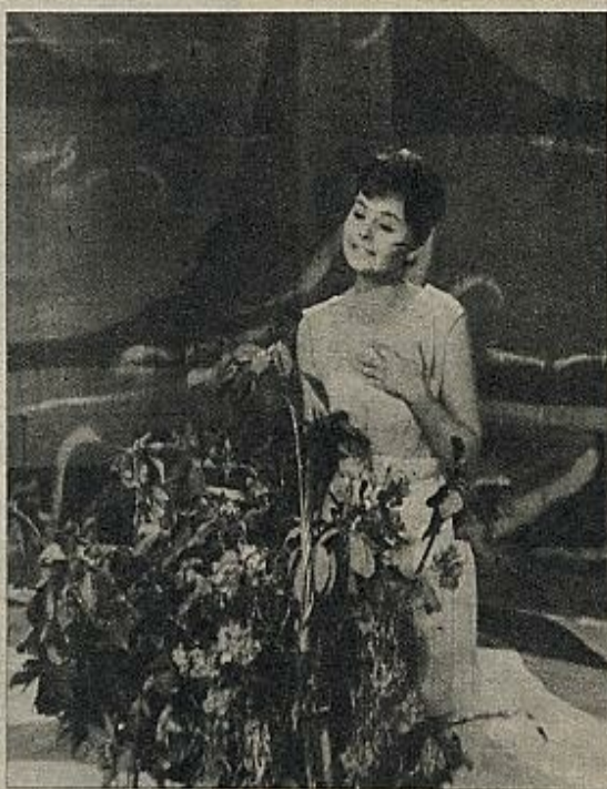
«Quisiera ser un ángel», «Canción de juventud» y «Canta conmigo», éstas fueron las canciones interpretadas por la joven estrella del cine. Y para cerrar, unas alegrías a la guitarra

Excelente fue también, sin duda, la actuación de la estrella sudamericana Lydia Scotty, muy popular en América por el éxito alcanzado en las mejores salas de fiesta de Montevi-