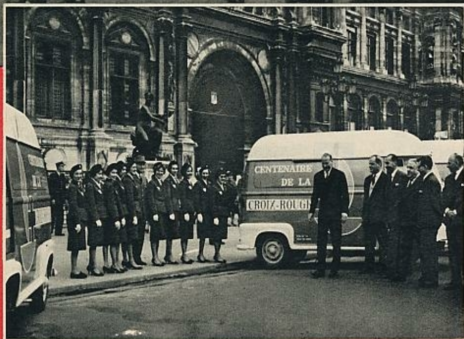
Para conmemorar el primer centenario de la Cruz Roja se han organizado una serie de actos entre los que se encuentra una exposición ambulante que mostrará los equipos utilizados por esta benéfica institución.