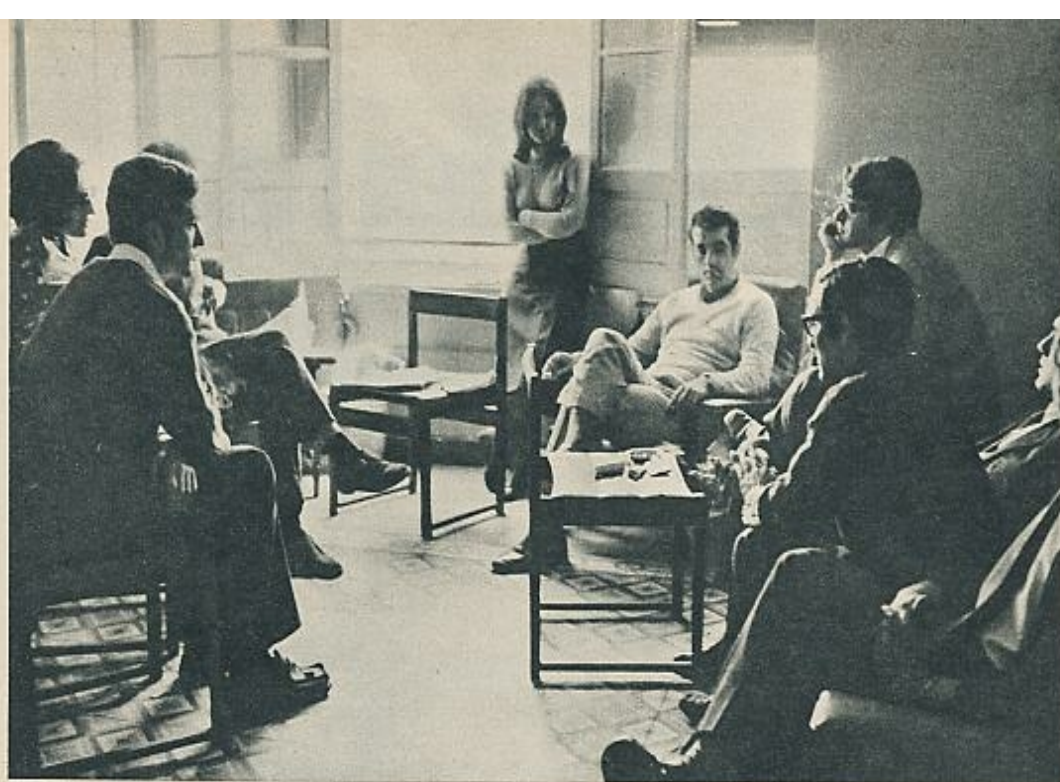
Estos son algunos de los médicos residentes del Psiquiátrico de Oviedo. Discuten todos sus problemas y toman sus decisiones por votación democrática. Su sala de estar es un centro de interés nacional durante los días de la crisis. Este chalet —antigua vivienda del administrador— es la Residencia de los médicos del Psiquiátrico de Oviedo, que está aislada telefónicamente y cuyos suministros de comida quedaron también cortados para los veinte residentes teóricamente expulsados que permanecen en su interior.

que no se llegase a un entendimiento de unos problemas que, en definitiva, dada la dedicación exclusiva del cuerpo médico, eran en interés del Hospital Psiquiátrico.