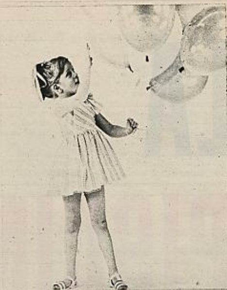
Vestido en piqué estampado de nylonrosa y blanco

ENTRE aquellos niños del siglo XIX. verdaderos adultos bajitos escapados del «Corazón» de Amicis y los niños de hoy, felices en sus trajes livianos, cómodos, alegres, sin botines ni cuellos almidonados, hay un abismo. Si su vida ha cambiado mucho no hay duda de que una gran parte del cambio se la deben a la moda que, por primera vez, ha creado algo pensando en ellos, en sus necesidades, sus gustos y su mundo particular.