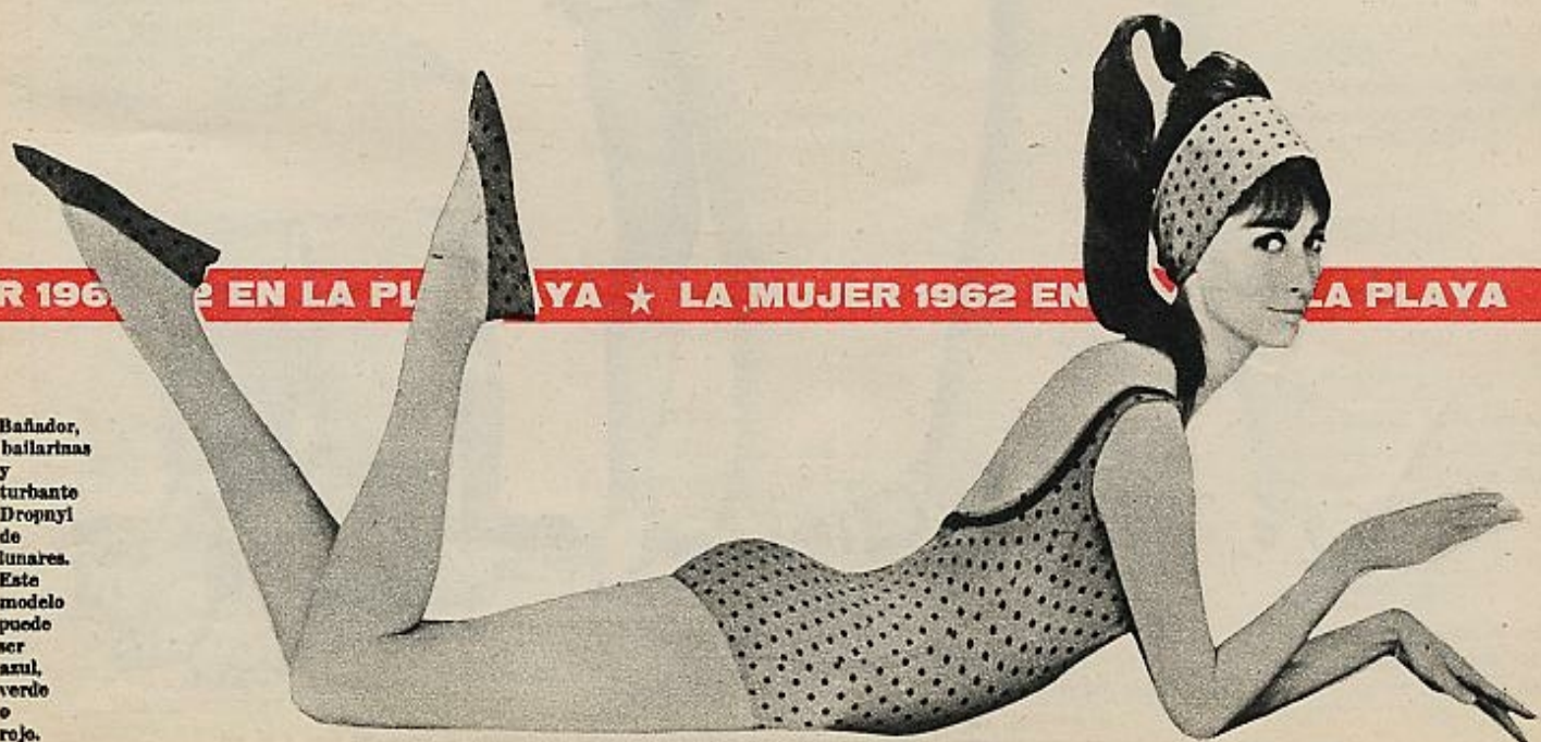
Bañador, ballarinas y turbante Dropnyl de lunares. Este modelo puede ser azul, verde o rojo.

JER 1962 EN LA PLAYA ★ LA MUJER 1962 EN LA PLAYA