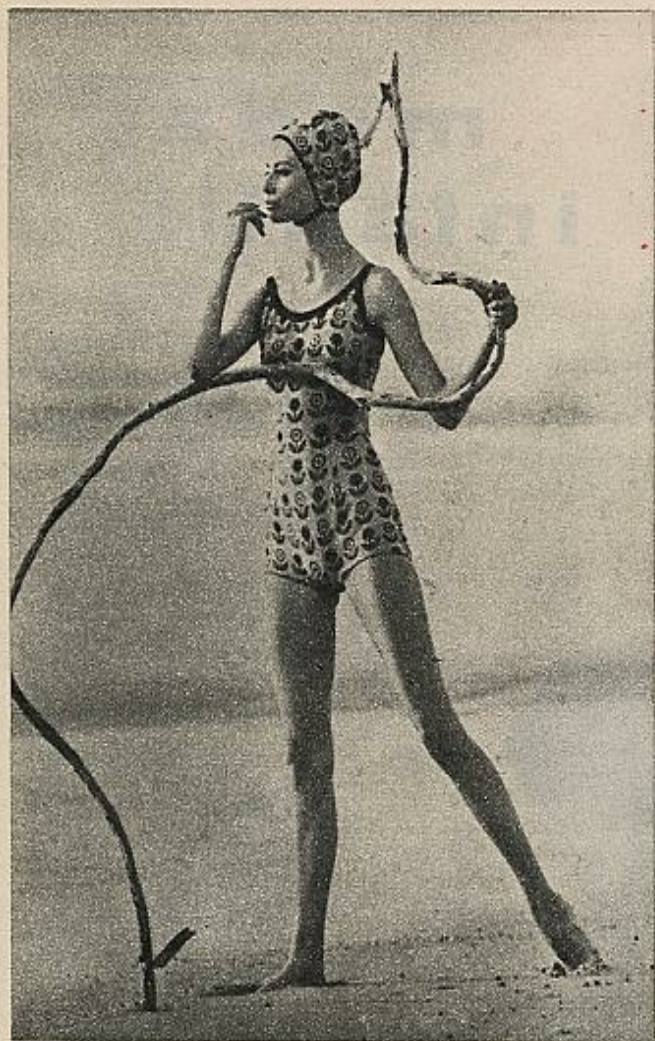
Bañador y gorro azul porcelana con flores estampadas en negro