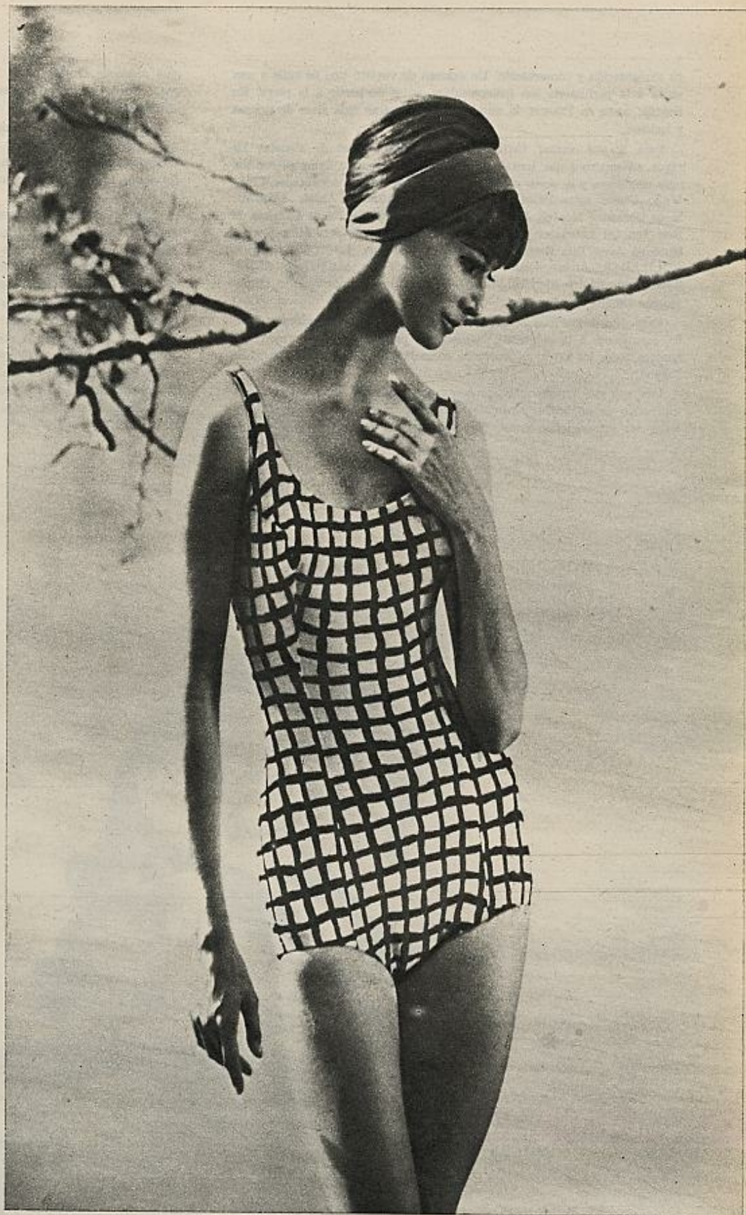
Bañador Dropnyl blanco a cuadros negros.