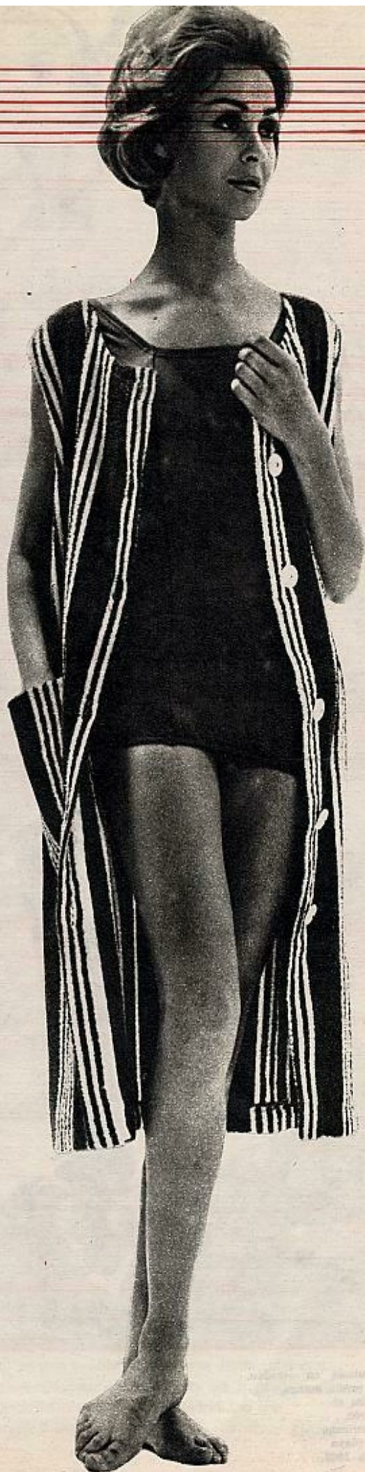
Bañador negro y albornoz de esponja a rayas con botonadura completa, creación de la Alta Costura francesa.