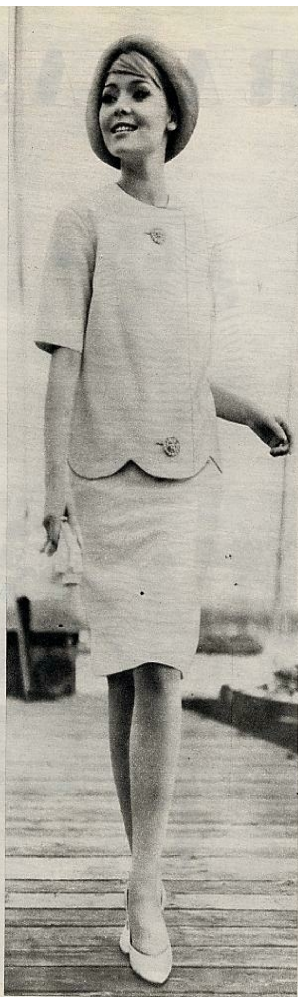
Sastro de verano en color pastel, de lana de angora, grn novedad de la moda alemana.