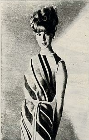
Vestido en hilo gris, naranja, blanco y negro. Doble bies como cinturón.