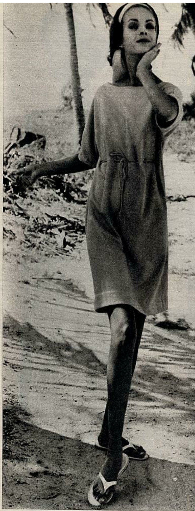
Camisola en algodón, de media manga, según el patrón americano de playa para 1962.