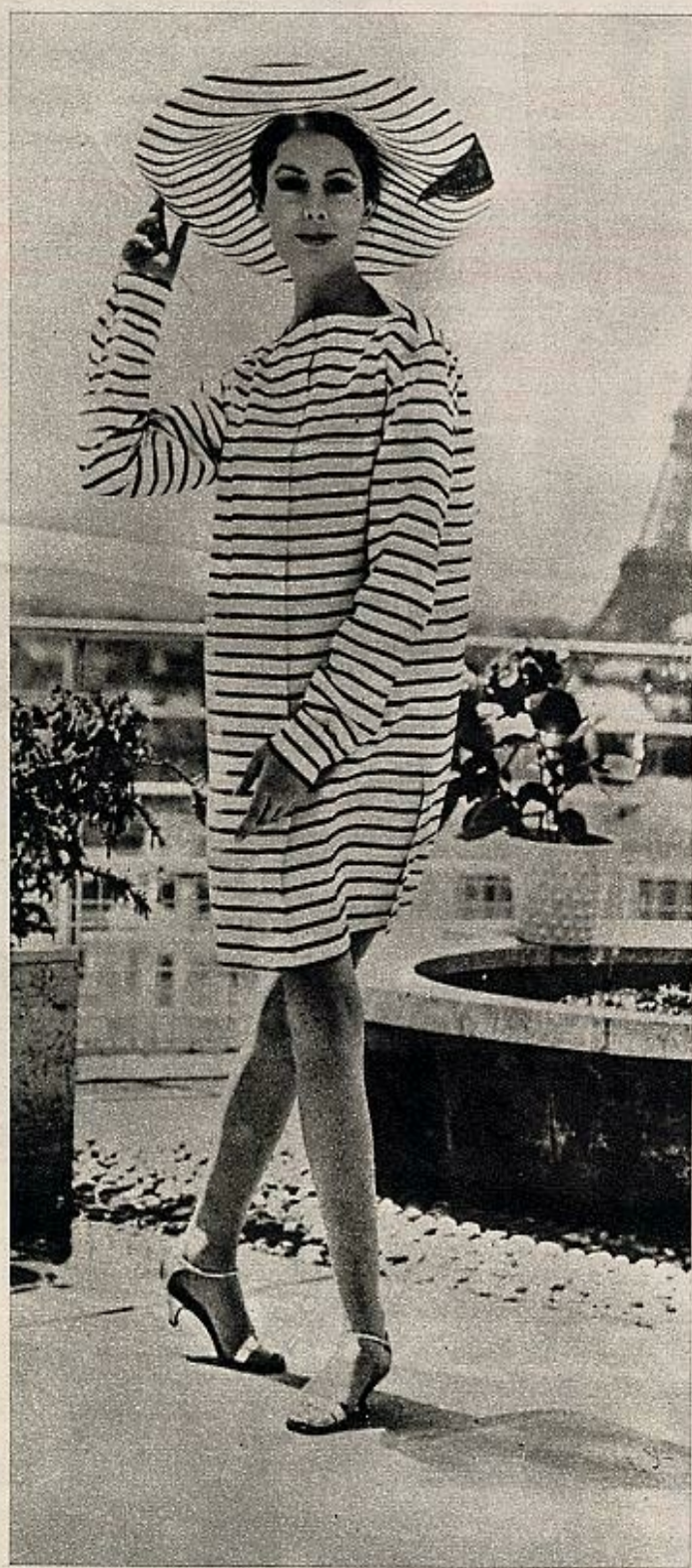
Modelo playero de Nina Ricci en algodón rayado con sombrero del mismo material.