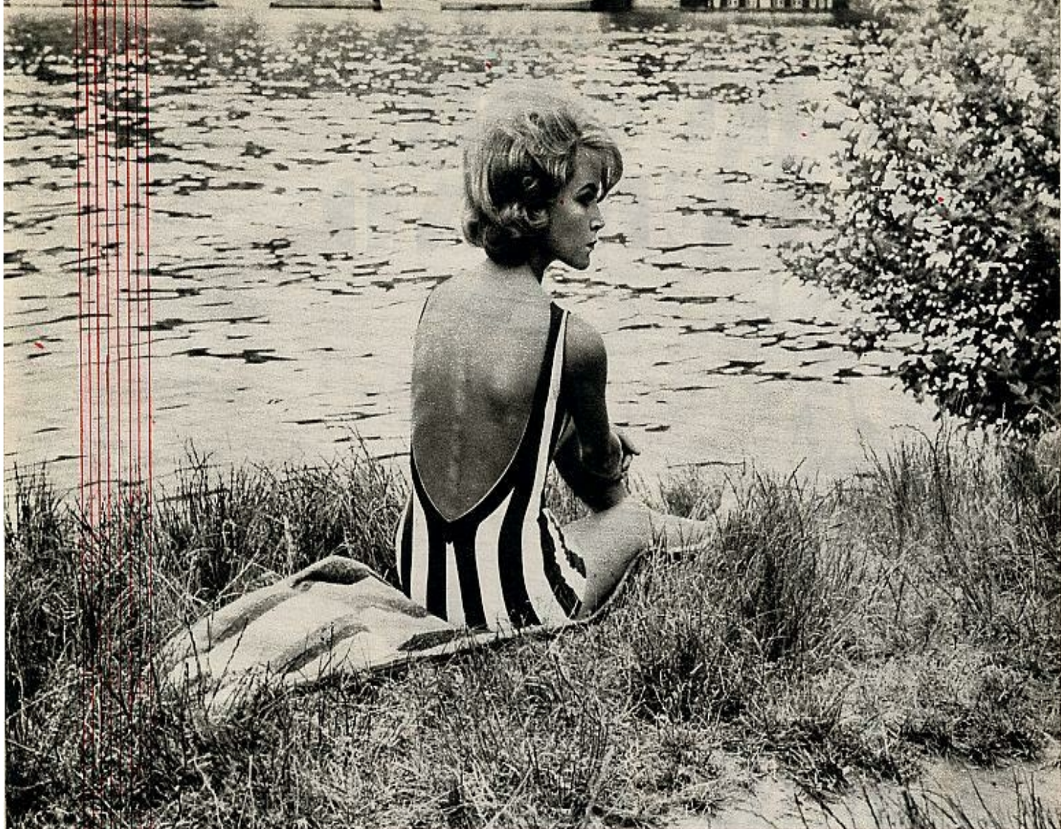
Bañador a grandes rayas azules y blancas, muy escotado atrás