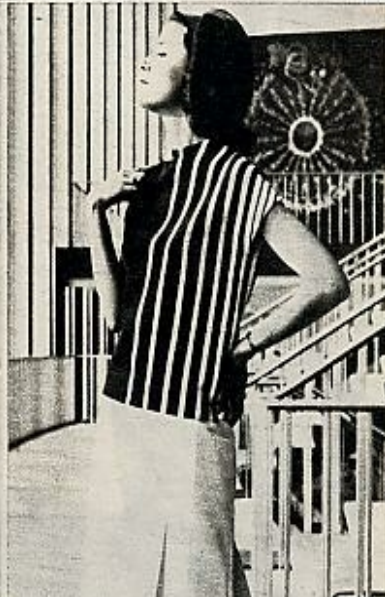
Falda veraniega y blusa a rayas verticales blancas y azules a un solo lado.