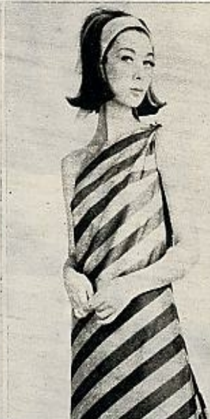
Vestido a rayas sesgadas en tres tonos, sujeto al hombro izquierdo con un nudo.