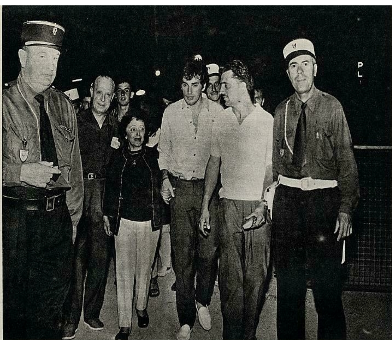
rodeados de «fans», como en los mejores tiempos de la piaff