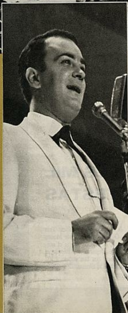
Un escenario de cuarenta metros, dos grandes orquestas, tres días lleno el Palacio de los Deportes para esc