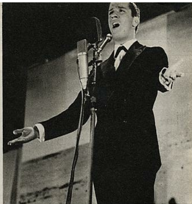
Ennio Sangiusto, que se destacó bailando un twist en pleno «Bricciole di luna», sabe cantar melodías románticas. Sangiusto, el llamado «León de Trieste», el «cantante catapulta», ha cosechado los aplausos más fuertes del Festival.