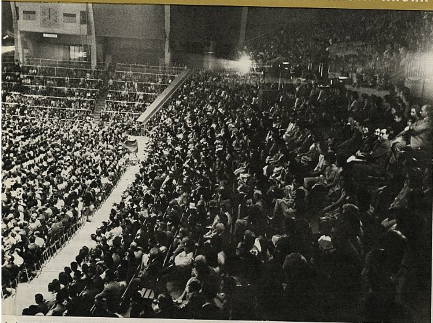
char las canciones del Mediterráneo. Un éxito sensacional para la Televisión Española y para Radio Nacional de España, que han sido los organizadores del Festival.