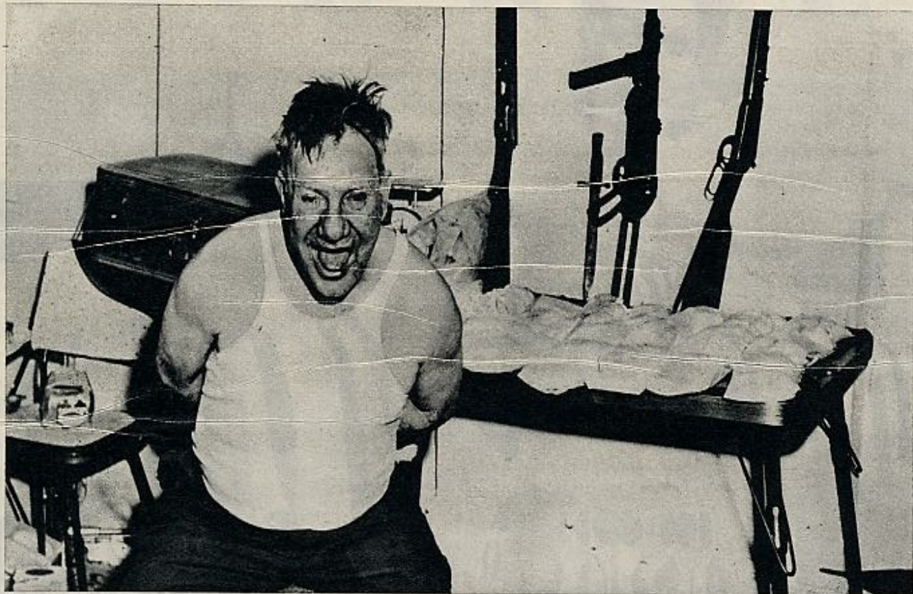
Fuca, en el sótano del 245 de la Séptima Avenida, después de su captura. Durante mucho tiempo, esta heroína habría satisfecho a millares de drogados.