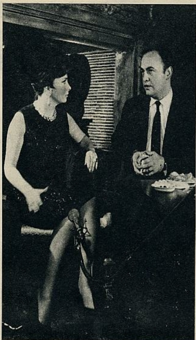
de ganar el terreno que como halla hoy muy comprometida.