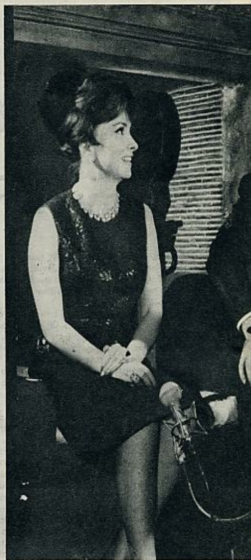
En «Venus Imperial», Gina busca, ante todo, la posibilidad estrella le ha arrebatado Sofía Loren. Su posición se