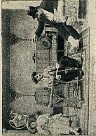
El truco cómico siempre renovado: «Curra de aguas»

trín, sin clase social, que no sabe adónde va ni de dónde viene, este hombre sin raíces, sin pasado y sin porvenir, este hombre en continua frustración de todo lo que constituye la vida, es sencillamente esto: el hombre que sobra, el hombre superfluo. Lo que en el secreto de nuestro espíritu y en la realidad diaria de la vida nos sentimos todos, poco o mucho, en esta época de máquinas todopoderosas, de guerras universales, de matanzas de millones de hombres de manera científica y organizada, y de millones de exiliados sin patria, vagabundos sobre la tierra, de perpetua amenaza de destrucción total bajo la fuerza