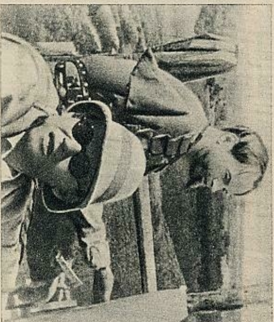
Cherkasov, de pie, durante la filmación de «Alejandro Nevski»

A CTOR. Nació en Piatroburg, URSS, el 27 de Julio de 1903. Uno de los más grandes actores de todos los tiempos. Su formación y evolución es representativa, porque parte de los orígenes del arte del comediante, reproduciendo en sí, reducida, una trayectoria histórica de siglos. Hijo de un empleado de Banca, quiere dedicarse a la música y comienza esta carrera. Pero aún niño asiste a una representación de la ópera «Boris Gudonov», cantada por Chaliapin. Es la gran revelación. In del teatro, y la idólatría por el maravilloso bajo ruso. A los quince años actúa en pequeños papeles de reparto, en el teatro Marinsky, y en la compañía «Estudio del Joven Ballets», de la ópera de Leningrado, como mimo; aquí, a veces, dobla a su admirado Chaliapin. Sigue un curso de declamación en el Institut Escenicheski Iskustv, que luego será el Leningradskí Teatrnik Institut. Y al acabar sus estudios se dedica a la pantomima acro-