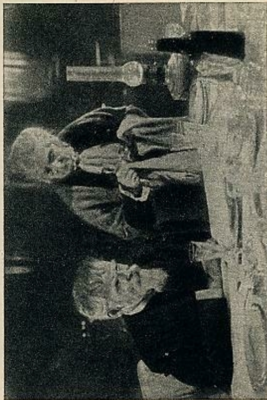
En «El diputado del Báltico»

Su primera aparición en la pantalla fue bajo la dirección de Gardin en «Poeta y zar», en 1927. Interpreta como una docena de películas más, en papeles de toda clase y categorías. Pero su gran creación, que le sitúa definitivamente en el cine, como una máxima figura, es en «El diputado del Báltico», de Zarkhin y Heifitz, en 1936. En adelante, su labor seguirá, en cierto modo, las directrices del cine soviético, oficialmente marcadas. Interviene en las películas juveniles, que tienen cierto auge a finales de los años 30: «Los hijos del capitán Grants» y «La isla del tesoro». Después, las grandes figuras tradicionales de la historia rusa. En «Pedro, el Grande», de Vladimir Petrov — película comenzada en 1937 y terminada en 1939 —, interpreta extraordinariamente el papel de Zarevich. Luego, sus grandes creaciones: «Alejandró Nevski» e «Iván el Terrible», de Eisenstein. Por otro lado, va surgiendo la tendencia a cantar las figuras de la Rusia moderna, principalmente intelectuales y artistas como «Alejandró Popov», «Mussorsky», «Himsky Korsakov», cuyo rol principal oficial era Gregory Rosal. Aparte de las películas sobre temas de la revolución, como «Lenin en octubre», de Míleikil Román — papel de Gorki —, y