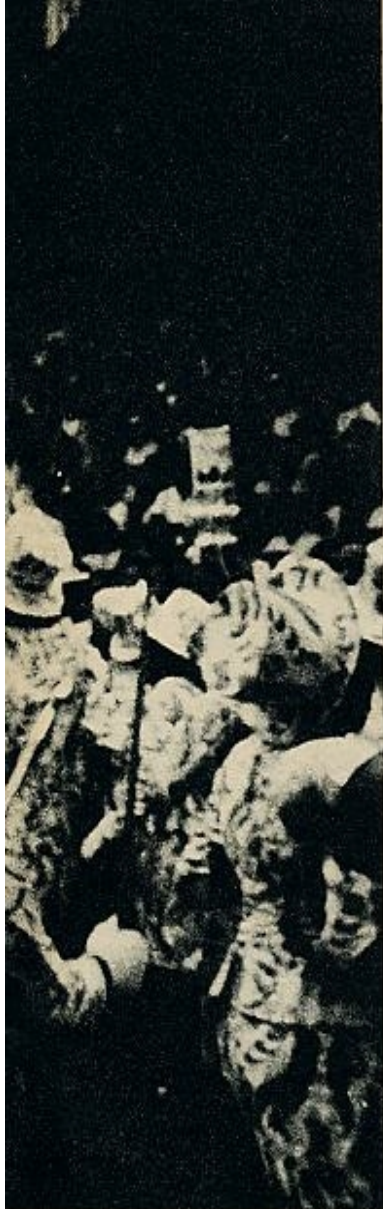
multitudinario a una ilusoria libertad.

Carnaval en Río. Sin accésit final, sin pedagógicas conclusiones, sin la violencia ni la burla cruel de las tierras áridas y duras. Carnaval del trópico, que irrumpe desde el cafetal, desde los algodones, desde las selvas, alzando sobre una realidad terrible la ilusoria bandera de una libertad idealizada, mistificada en el grito, el ritmo desatado, la costumbre rota. Carnaval en Río... con drama final: cincuenta y ocho muertos, dos mil heridos, mil quinientos detenidos. Un trágico límite que devuelve al mundo verdadero a los protagonistas de la farsa, camina ya, al cuarto día, de las plantaciones, las cabañas, la jungla, a tocar nuevamente el universo material, tal como es. Y a pensar, quizá, una vez más, en la fantástica liberación del año próximo.