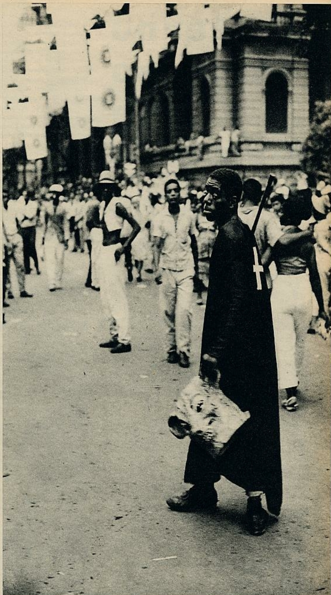
El final está cercano. Ya se ha descubierto, bajo la máscara, la tristeza del negro, el cansancio, la estéril marca de una libertad efímera. Y ahora, otra vez a soñar con la fiesta del año próximo. La rueda de la dura vida cotidiana sigue girando.