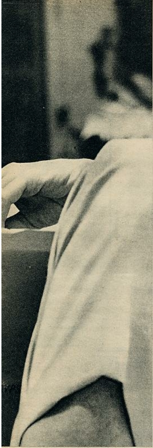
con vida normal: está casada, tiene un marido y un hijo.

mo, se decidió a aceptar unos papeles para cine y en seguida la Metro la contrató por siete años. Aunque tenía el propósito de abandonar el cine en cuanto el contrato terminase, ha permanecido en Hollywood, con breves períodos para trabajar en teatros de Nueva York, casi treinta años, y ha hecho un total de 45 películas.