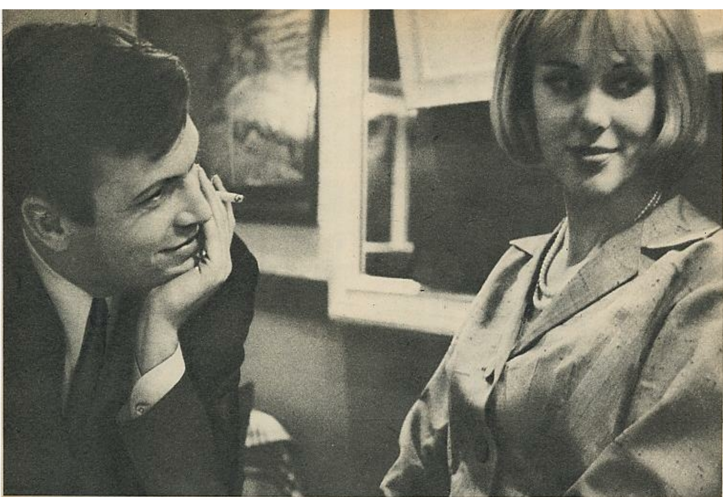
Ellen Kessler se casará con Umberto Orsini, uno de los mejores actores italianos del momento. Orsini interpretó en España «Noche de verano». El prometido de Alice Kessler se llama Marcel Amont. Es un cantante francés que acaba de regresar de realizar una gira por diversas capitales.