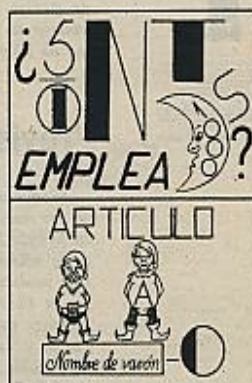
—¿Vencieron tus alumnas?