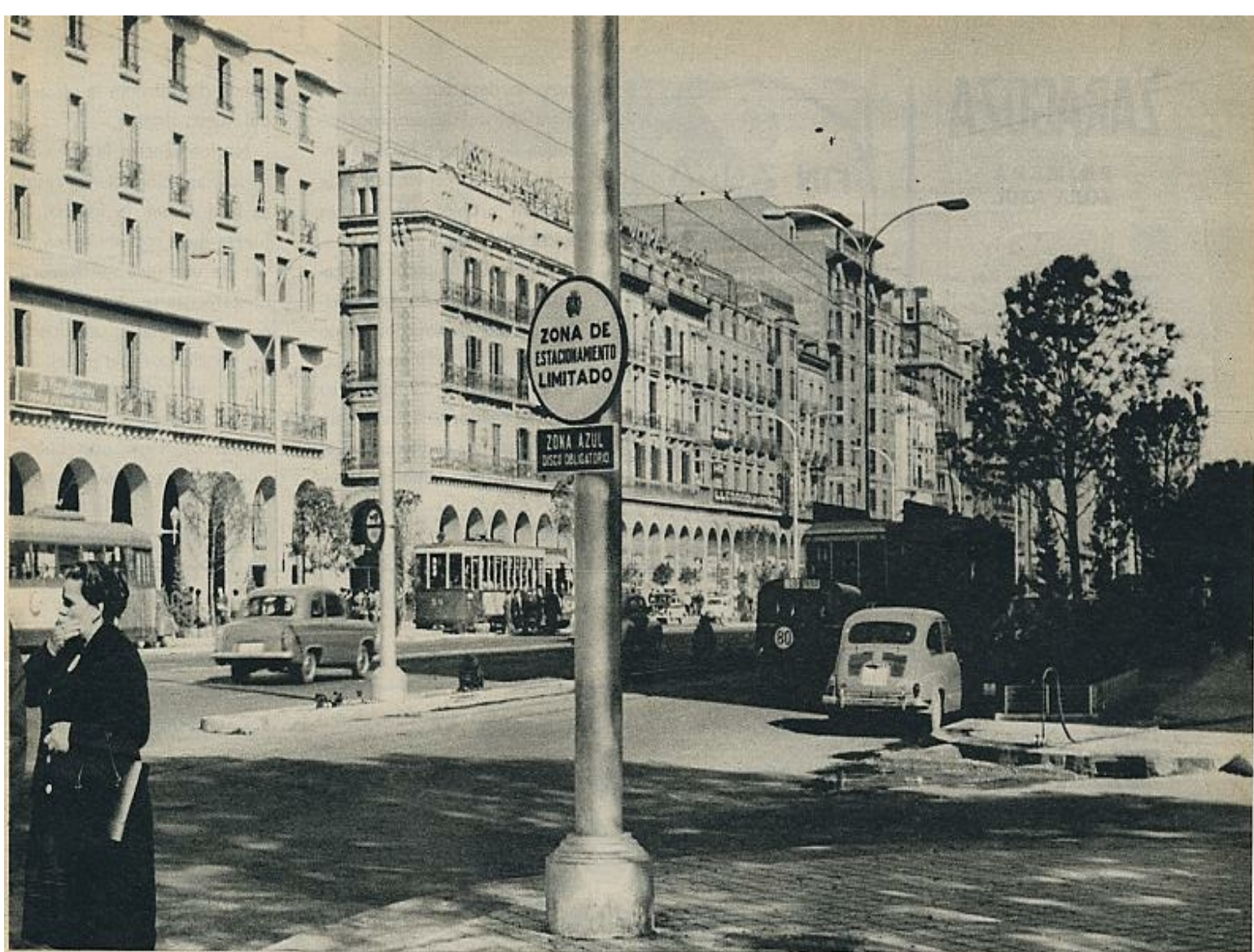
Zaragoza ha resuelto el problema del ahogo, en las zonas céntricas, del tráfico automovilístico. Desde hace diecisiete meses funciona, con éxito, su «Zona Azul».