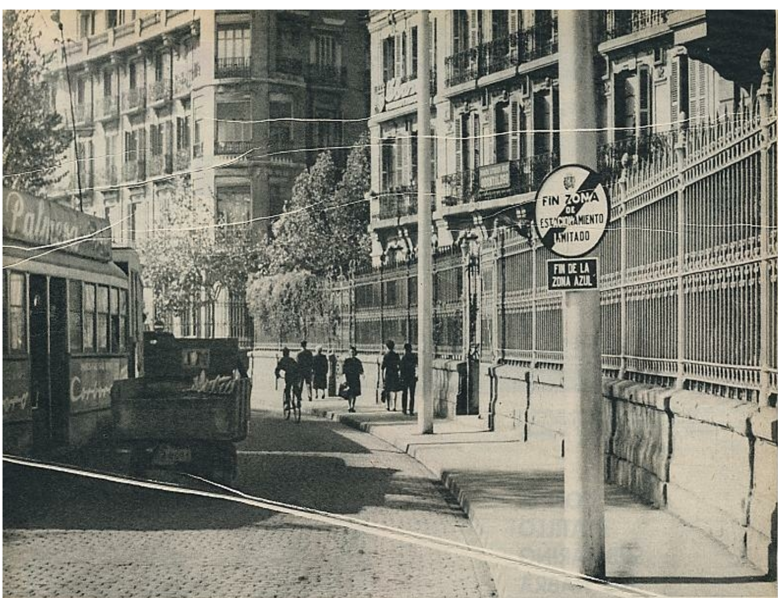
La implantación en Zaragoza del nuevo sistema no resultó sencilla. Hubo oposición por parte de un sector de la población y de la prensa. Pero el Municipio consiguió su prop...

uenta con ello al iniciarlo. Se reprochó al Ayuntamiento abuso de autoridad, se lamentó la incomodidad de la nueva ordenación, se recurrió a argumentaciones de todo tipo para impedir la realización del proyecto. Pero a todo, el propósito municipal prevaleció y hoy el respeto a las nuevas normas es un hábito, vigilado con rigor por seis agentes con sescientos metros de calle, respectivamente, a su cuidado, sobre una zona de cerca de 150.000 metros cuadrados. El sistema de control, análogo al utilizado en París, se efectúa mediante la colocación en el parabrisas del automóvil de una tarjeta en la que se marca la hora de llegada y la duración límite del estacionamiento.