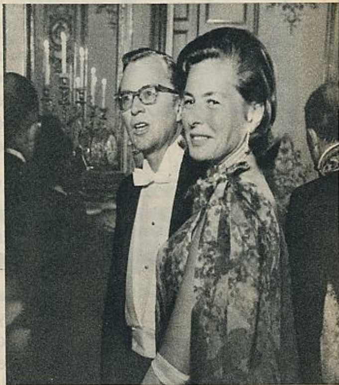
En el Palacio del Elíseo se celebró una brillante recepción de gala a la que acudió el «todo París». Entre los invitados, Ingrid Bergman y su marido.

rano sueco responde al saludo de bienvenida que unen a las dos naciones son profundos.