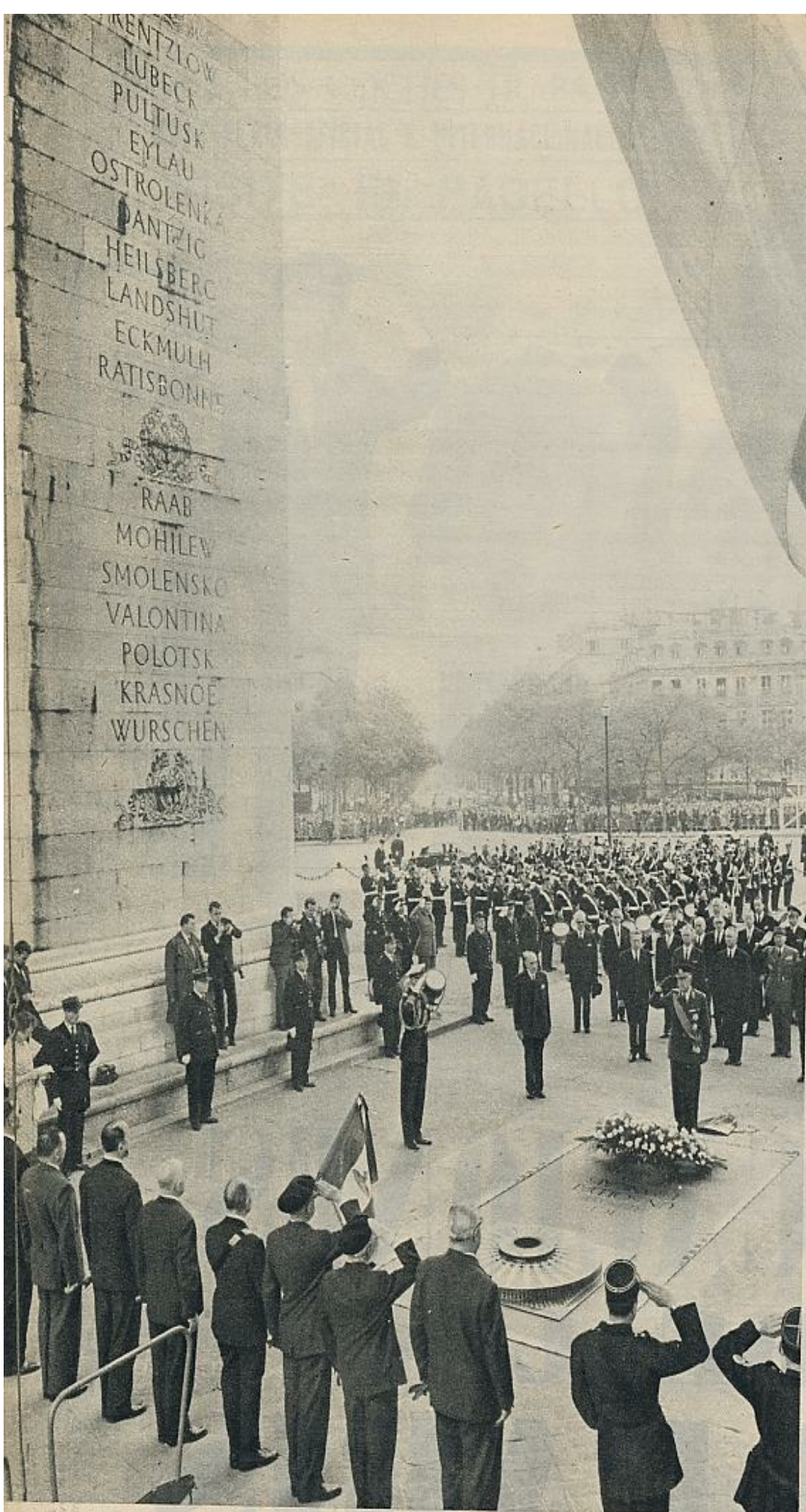
El rey Gustavo Adolfo de Suecia, de uniforme, deposita una corona de flores ante la tumba del Soldado Desconocido.

Por otro lado, aunque desde 1908 nunca había visitado oficialmente París un rey sueco, Gustavo Adolfo es un gran conocedor de la capital de Francia, país donde ha residido largas temporadas antes y después de la guerra. Además, para los franceses, Gustavo