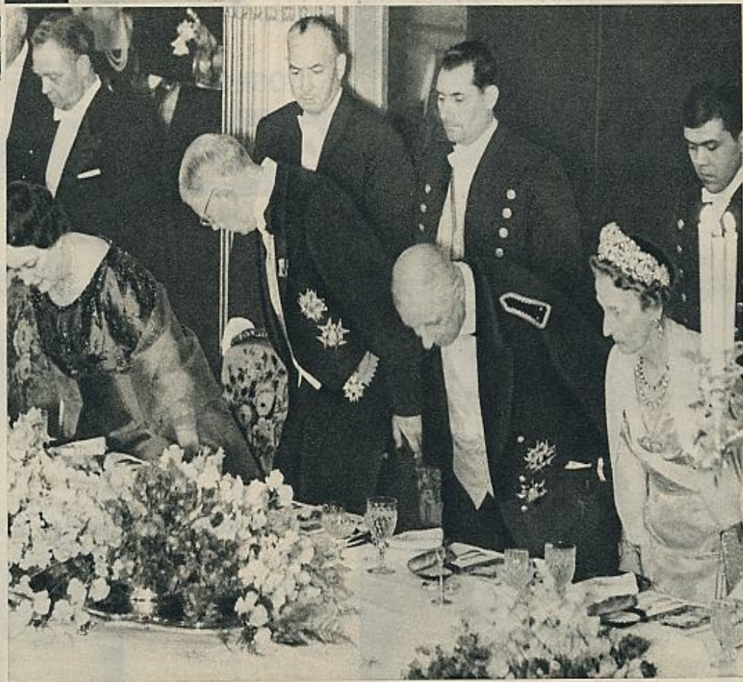
La reina Luisa y madame De Gaulle toman asiento al mismo tiempo que los dos Jefes de Estado, en la cena de gala.

Luego de un almuerzo íntimo en el Elíseo, el rey depositó una corona de flores en la tumba del Soldado Desconocido, mientras que la reina Luisa visitaba la fábrica de los famosos tapices de Gobelinos. Por la noche, SIGUE