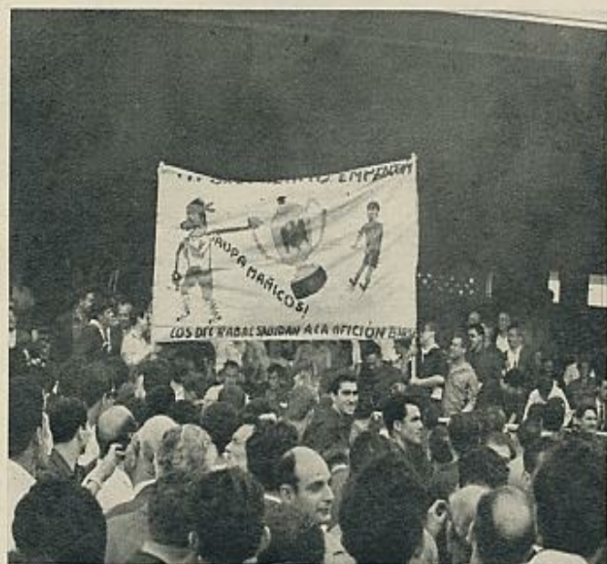
La trayectoria del Zaragoza a lo largo del torneo le auguraba amplias esperanzas. En el campo, una buena cantidad de hinchas le prestaron su apoyo moral.