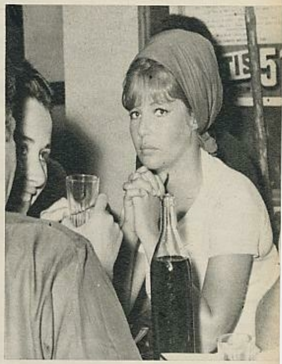
Annette Stroyberg, la ex señora de Roger Vadim, veranea en Saint-Tropez sin Vittorio Gassman. Con unos amigos, ante una botella de tinto, en el «Café des Arts».