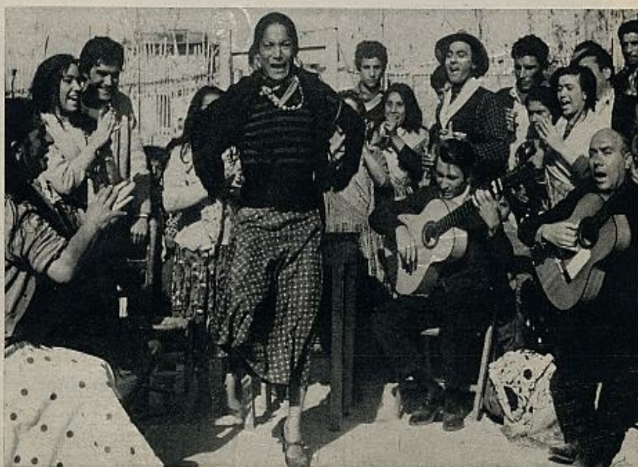
Las intervenciones de Carmen Amaya en el cine fueron esporádicas. Arriba, con Pastora Imperio, en «María de la O». En el centro, en «Pasión gitana», rodada en Méjico hace años. Abajo, por fin, en «Los Tarantos».