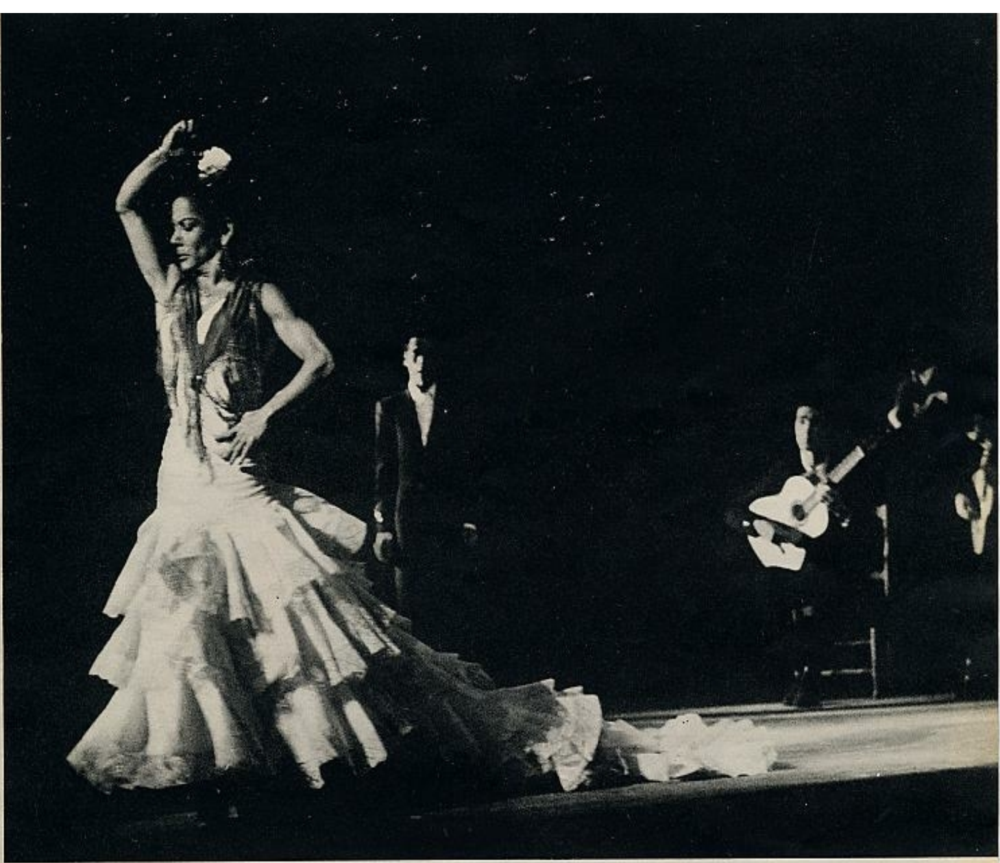
Carmen —llama, volcán, meteoro— llegó a la cúspide de su ancha fama recorriendo los escenarios más ilustres del mundo. Pero nunca se desarraigó y soñaba con sus breves escapadas a España. La fotografía de abajo nos la muestra, acompañada de su marido, presenciando una corrida de toros en la Plaza de las Ventas.

Pero «El Chino» se libra muy bien de llevar a Carmen a los colmados. Se limita a hacerla bailar al aire libre, en la terraza del quiosco de bebidas que está al pie del monumento a Colón, entre fotógrafos minuterios y vendedores de cacahuetes.