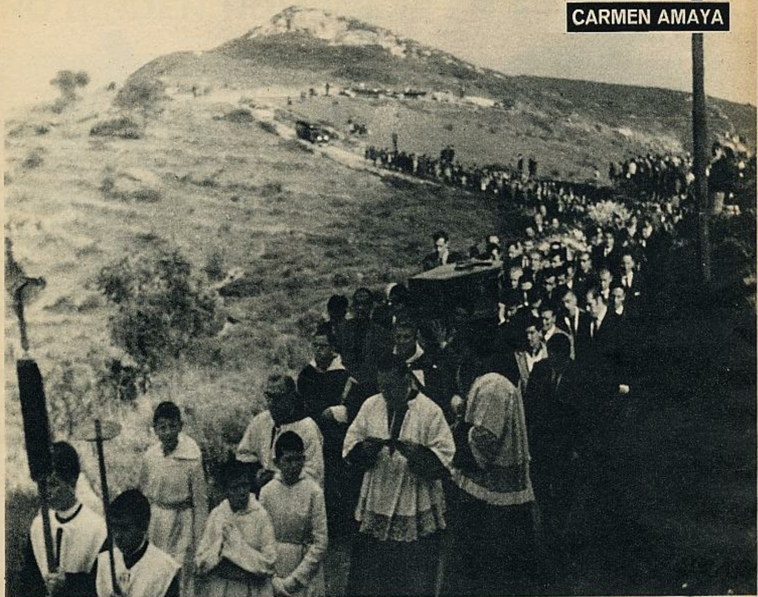
Por última vez, el cuerpo de Carmen Amaya, ahora definitivamente quieto y trasladado a hombros de los demás, recorre las lomas de Bagur, frente al mar que amó tanto.

De la Argentina salta al Brasil, donde gana catorce mil dólares semanales. Y desde Sudamérica remonta el continente para plantarse en Estados Unidos, precedida por una fama estruendosa y, con lo que vale más, con su firma estampada al pie de un contrato con el célebre empresario Urok, quien se compromete a presentarla en sus ciento cincuenta teatros estadounidenses.