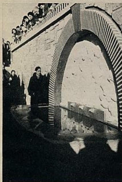
La desaparición del viejo Somorrostro no supondría la de la fuente «Carmen Amaya». La bailarina contempla la de nuevo cuño que sustituyó a la original.