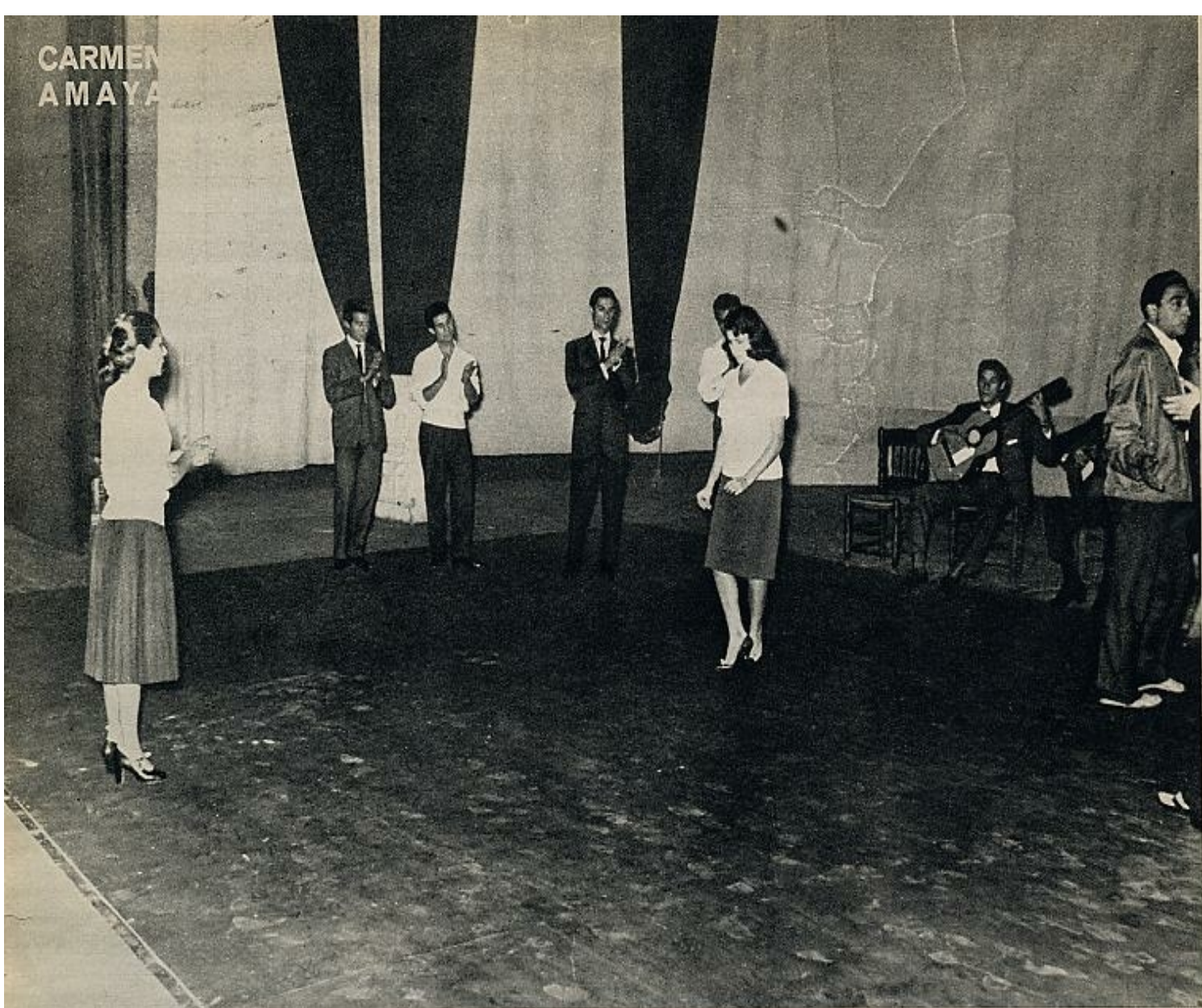
Sin merma del margen que, a la hora de la verdad, concedía a la improvisación, Carmen Amaya cuidaba con todo rigor y detalle los ensayos de sus espectáculos.

lo atribuye al temor de reavivar en su alma recuerdos demasiado lancinantes.