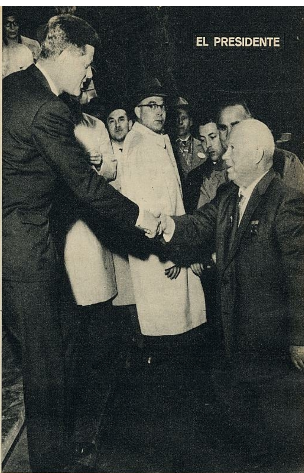
Kennedy y Krushev en su primer encuentro, en Viena, en junio de 1961. Todo un símbolo de una política de coexistencia que, contra viento y marea, iba a instaurarse en el mundo, cuya continuidad es problemática...

R EPITO que la historia de aquellos quince días trágicos no está escrita, y pasarán quizá muchos años hasta que se escriba; pero que, desde aquel momento, arranca la verdadera carrera hacia la paz de Kennedy, no ya en competencia con Krushev sino junto a él. Este año que ha transcurrido desde entonces ha sido el gran año de Kennedy. El año del «teletipo rojo» que podía mantenerle en contacto directo con el Kremlin, el año de la firma del tratado de prohibición de pruebas nucleares. Y, al mismo tiempo, la preparación de una serie de acuerdos generales con la URSS, el cambio político de Alemania Federal que permitía que un canciller nuevo, Erhard, desgajase a su país de la estela en que De Gaulle quería situarle para seguir el nuevo camino de la coexistencia: el año que le abocaba a un cambio político en Gran Bretaña con el mismo signo de su política. Iba a comenzar sobre estas bases su campaña electoral, y sobre una base de política interior que no desmentía su figura liberal y humanista: la liberación de la raza negra, sometida a los blancos en el Sur. La misma entereza, el mismo valor político para romper con el pasado que había mostrado en la escena internacional, dirigía sus actos en la lucha antirracista.