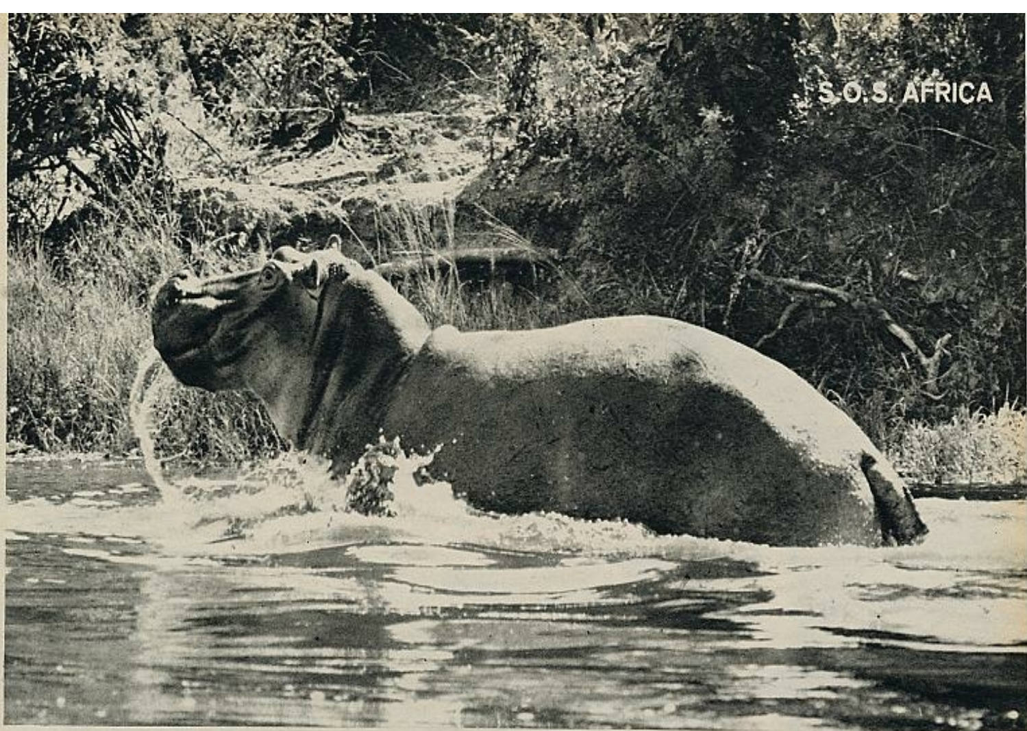
El pesado hipopótamo se mueve con sorprendente agilidad en el agua. De cada pieza se extraen treinta y seis kilos de grasa y una enorme cantidad de carne. Abajo, el temido rinoceronte, el de la carga mortal, el más perseguido. Se cree que, en su paulatina extinción, la pérdida se aproxima a la cifra de quinientos rinocerontes por año.