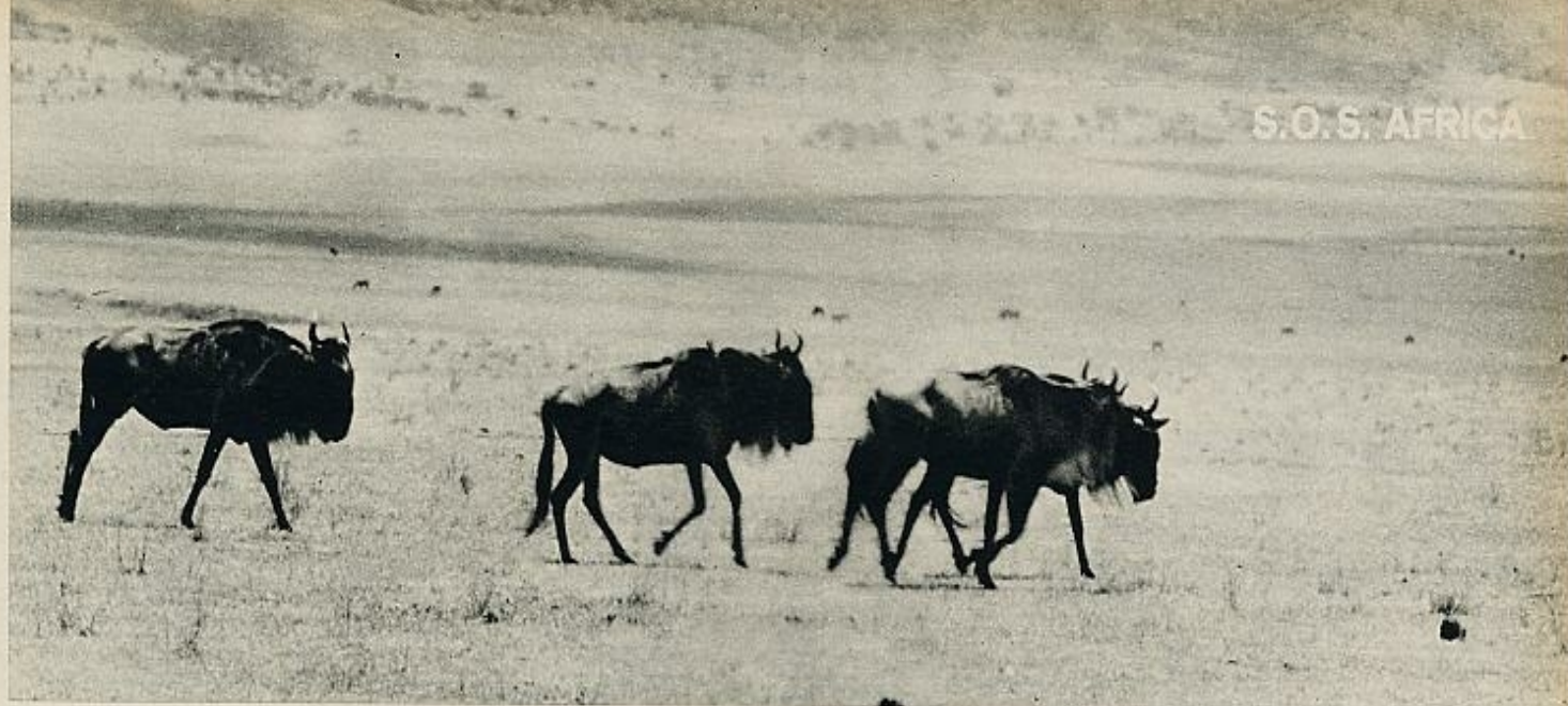
Famélicos rebaños de búfalos van en constante peregrinaje a través de estepas secas por la larga sequía. Es la especie más perseguida por los cazadores furtivos.

económica. En el pasado, los africanos consideraban a los animales como su principal alimento y será una tarea muy difícil hacer que cambien de actitud con respecto a la caza mayor, acostumbrados a ella durante siglos por urgentes necesidades vitales.