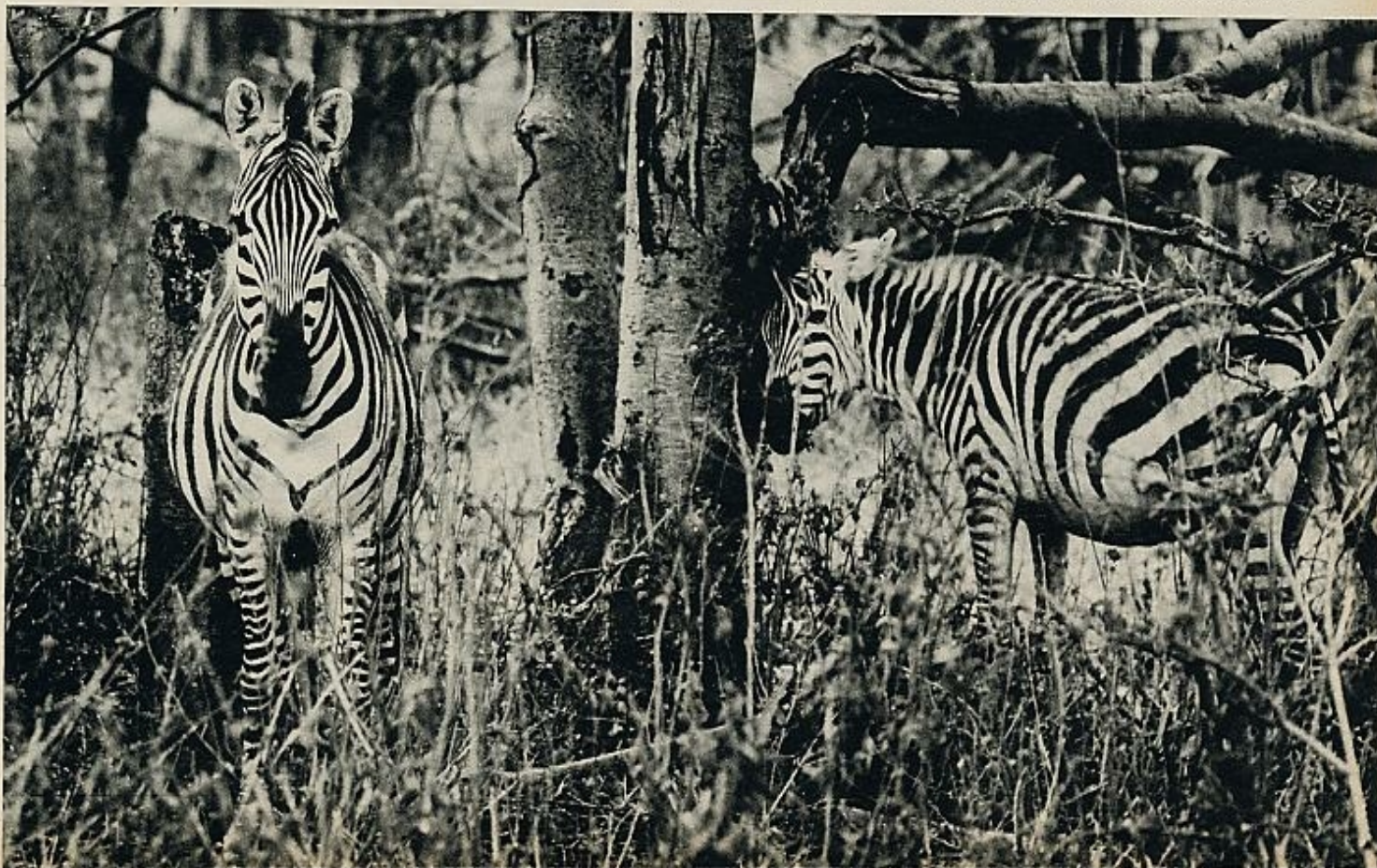
La cebra, uno de los animales preferidos por los niños de todo el mundo, nunca puede faltar en la presentación de una semblanza de las grandes selvas de África.

Los hipopótamos producen treinta y seis kilos de grasa, una buena cantidad de carne de gran calidad y cebo para la pesca en los lagos. Se considera que deberían ser aclimatados en granjas para protegerlos; normalmente pastan SIGUE