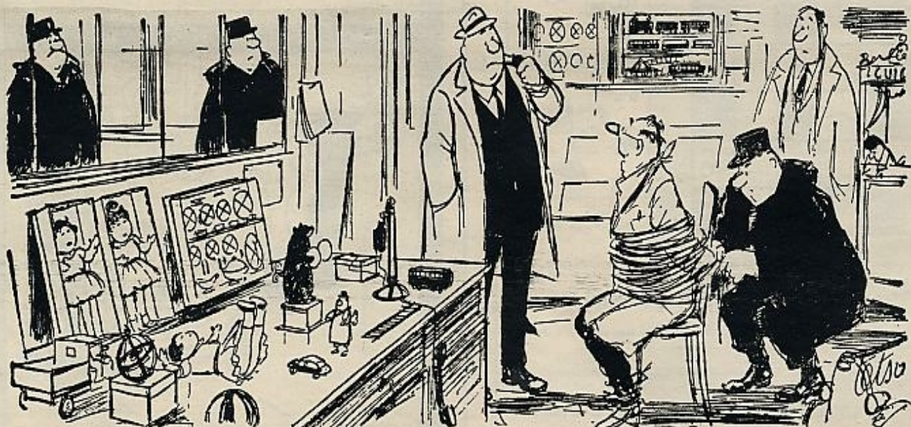
—Les digo que era Papá Noel... tenía una gran barba blanca y no se ha llevado más que juguetes.