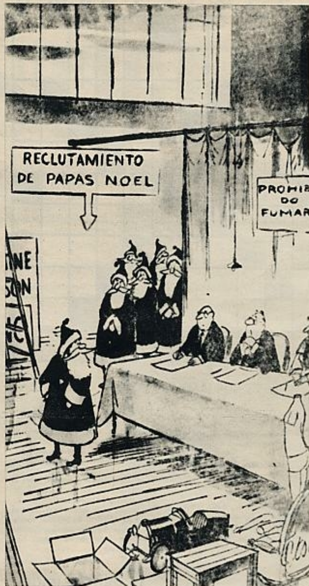
¡De la vuelta, camine!