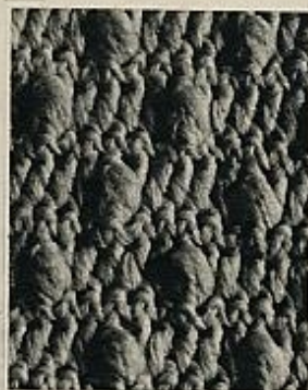
Túnica con capucha, en una sola pieza y mangas pegadas, tejida a ganchillo. Para confeccionarla se ha escogido una gruesa lana blanca.