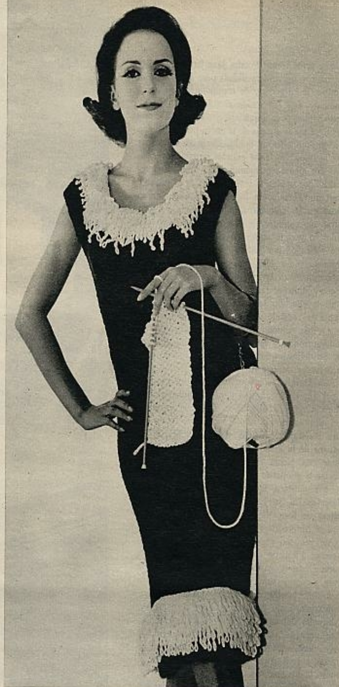
Original vestido de tarde, en «chenille» negra y punto jersey retorcido, adornado por varias hileras de flecos hechos en cordoncillo.

Las prendas de lana serán nuestras aliadas en esta lucha contra el frío. Suaves, esponjosas, confortables, modelan la silueta y le dan un aire eminentemente femenino. Y, además, están en primera línea en las más importantes casas de modas. Balenciaga, Dior, Cardin, presentan conjuntos tejidos a mano para la mañana, y abrigos y vestidos largos para día y noche. Ahora el punto ha dejado de ser algo reservado exclusivamente para los modelos deportivos y ha ampliado su campo de seducción a las ocasiones más elegantes y a todas las horas del día. Para las lectoras habilidosas, presentamos hoy varios modelos que ellas mismas pueden tejer. La lucha contra el frío empieza con un par de agujas, unos ovillos de lana y la dosis suficiente de paciencia para dar fin a la labor con pleno éxito.