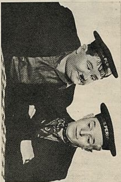
Oliver Hardy y Stan Laurel.

1935; «Die unmögliche frau», 1936; «El soberano» (Der Herrscher), «La tumba india» (Das Indische Grabmal), 1937; «La peste en París» (Verwehte spuren), «Lauter lieder», 1940; «Annelle», 1941; «Mit den augen einer frau», 1942; «Die gattin eine frau fur 3 tage», 1944; «Erziehung geschwister», 1945; «Dr. Holl», 1951; «Denn herr ist meine heimats», 1953; «El tigre de Bengala» (Der Tiger von eschapur), «La tumba india» (Das Indische Grabmal), 1958; «El testamento del Dr. Mabuse» (Das Testament von Dr. Mabuse), 1962.