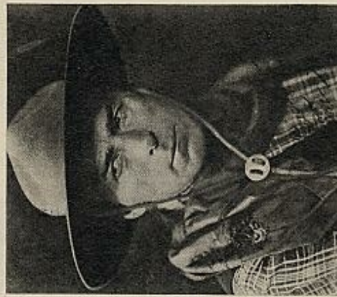
William S. Hart.

El cow-boy, sucesor del «pionero», es un tipo