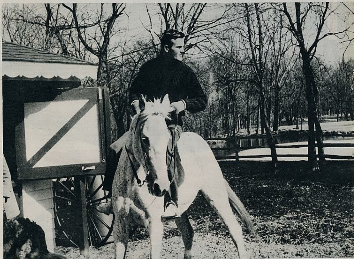
Sobre estas líneas, Tab Hunter que, a pesar de ser americano, tiene gustos ingleses, y, a pesar de no actuar demasiado, posee una bella propiedad, la recorre a caballo. Abajo, a la izquierda, otro de los miembros del «clan» Sinatra, Dean Martin, juega —naturalmente— al golf. A la derecha, Charlton Heston practica el tenis.

tes que, aunque procedentes de Inglaterra, se consideran como más típicamente americanos—son los preferidos. La natación, que en los años treinta hacía furor, parece, por el contrario, haber perdido prestigio. Pero en todo caso, en manifestaciones más o menos brillantes, en ejercicios que exigen más o menos preparación y entrenamiento, lo que es indudable es que los astros y estrellas, desde los que están en plena juventud a los que llevan veinte y treinta años de cine a sus espaldas, se sacrifican a la tradición del «americano sano y deportista».