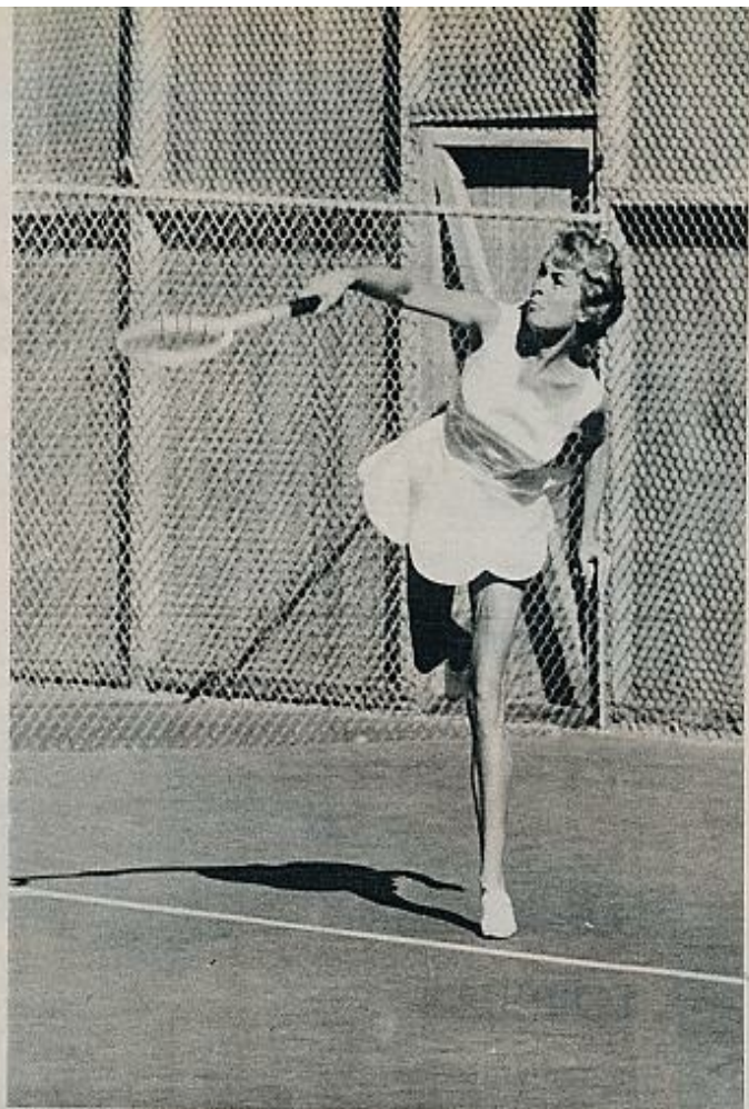
Kim Novak se conforma con la marcha a pie (arriba, a la izquierda), mientras Janet Leigh parece desahogar su enfado con la pelota de tennis (arriba, a la derecha). Por su parte, Anthony Perkins pasea flemáticamente en bicicleta (abajo, a la izquierda) y John Wayne, un día «hombre tranquilo», hace esquí náutico (abajo, a la derecha).