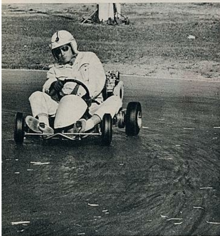
man, más dinámico, se inclina por el «go-karta» (arriba) y Rock Hudson es un experto en todo de la personalidad de los actores a través de su deporte favorito. Y segu- Muchos, incluso, podrían no gustar demasiado a los sujetos del «psicoanálisis».